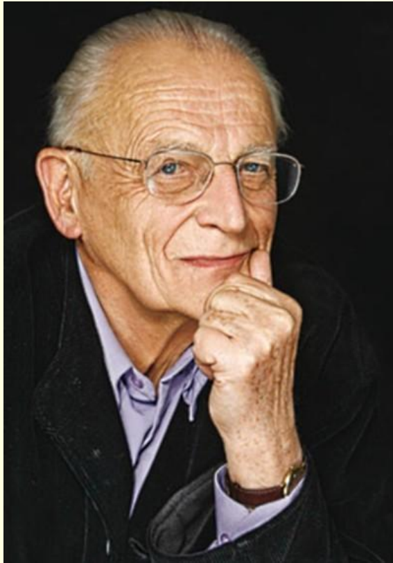
Теоретик деятельностно-активистского подхода, А. Турэн

А. Турэн выдвинул положение о сохранении в современном обществе субъекта социального действия. Он признает, что «в рыночной экономике, где главная забота — отказ от любого регулирования или экономического, политического и социального контроля экономической деятельности», исчезает тот социальный актор, который влияет на социальные и политические процессы своим участием в них. Однако физически «человек действующий» не ушел, он продолжает существовать и проявлять активность за пределами институтов глобализации или «глобализационных потоков», уже даже не пытаясь влиять на них. Т.е. радикально влиять на происходящее в мире он не способен. Но на локальном уровне, т.е. непосредственно в месте своего проживания, в ситуации трансформации, реформирования социальных институтов для защиты собственной жизни он вынужден делать попытки оказывать влияние на происходящее.