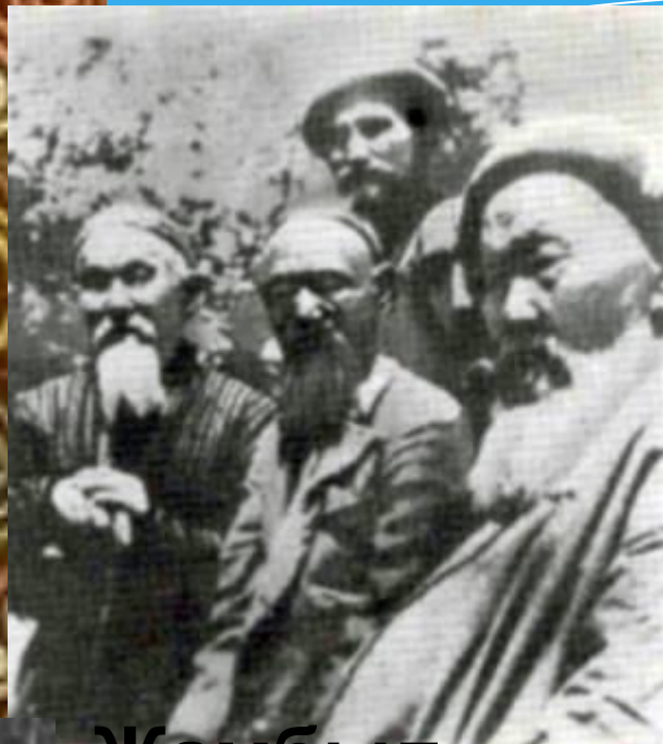
Жамбыл халық ақындарыны ң ортасында