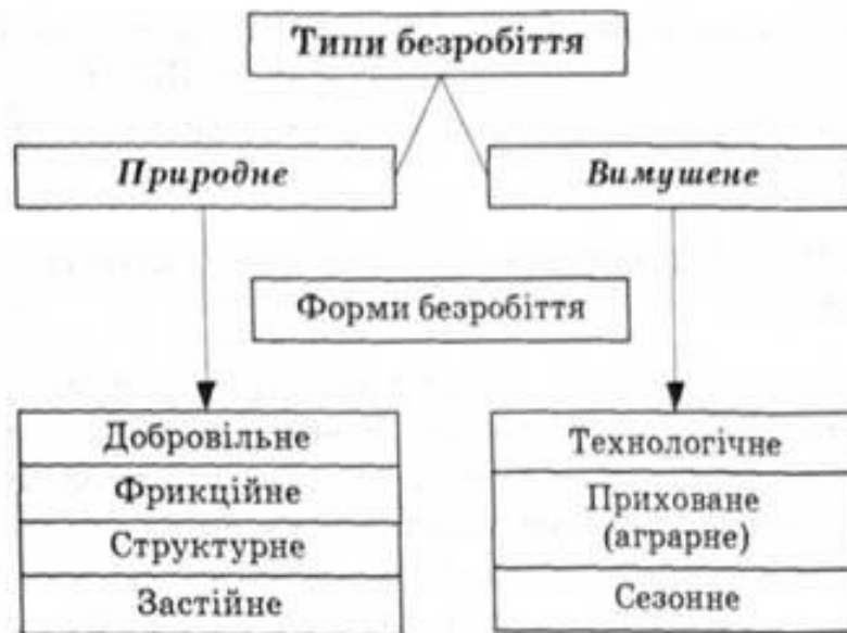
Рис.2. Типи безробіття.