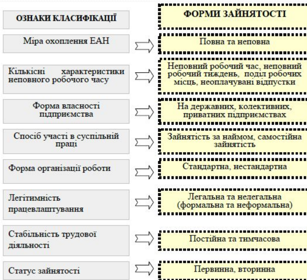
Рис.3. Форми зайнятості.

Форма зайнятості – це організаційно-правовий спосіб та умови використання робочої сили