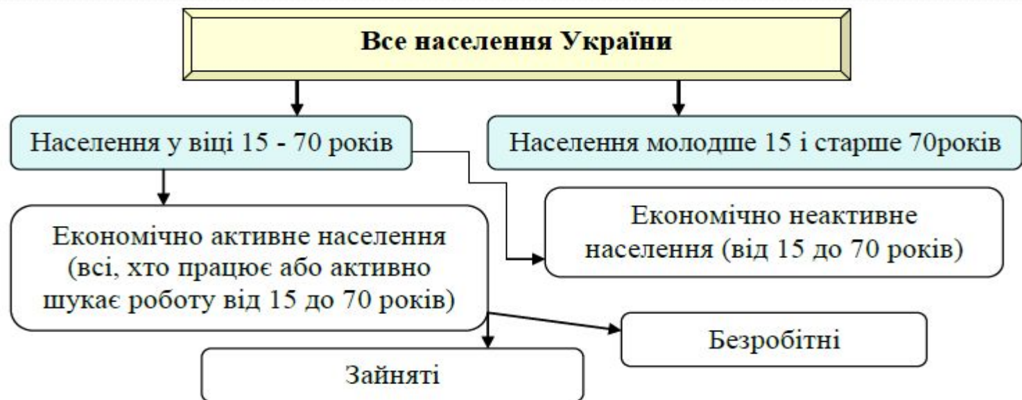
Рис.1. Структура населення України.

Зайнятість – це діяльність громадян пов'язана із задоволенням особистих і суспільних потреб, що не суперечить законодавству держави і приносить трудовий дохід.