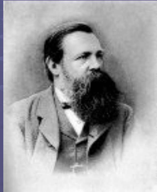
Ф. Энгельс (!820-1895)