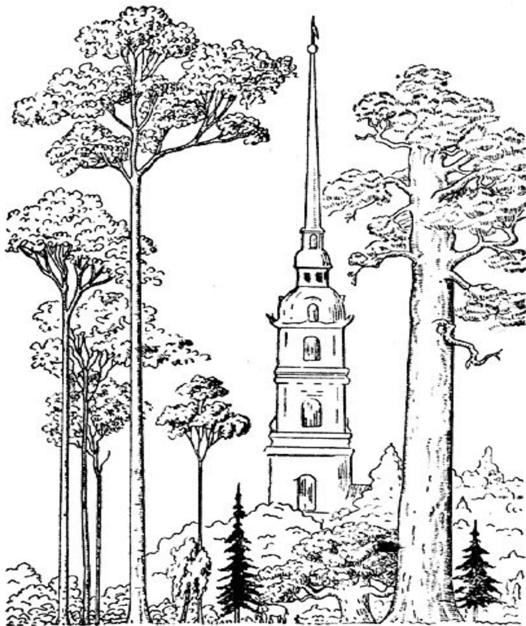
Рис. 1. Эвкалипты (слева), мамонтово дерево (справа), Петропавловская крепость (в середине), береза, ель, баобаб, слон и человек (Масштаб 1/1000)