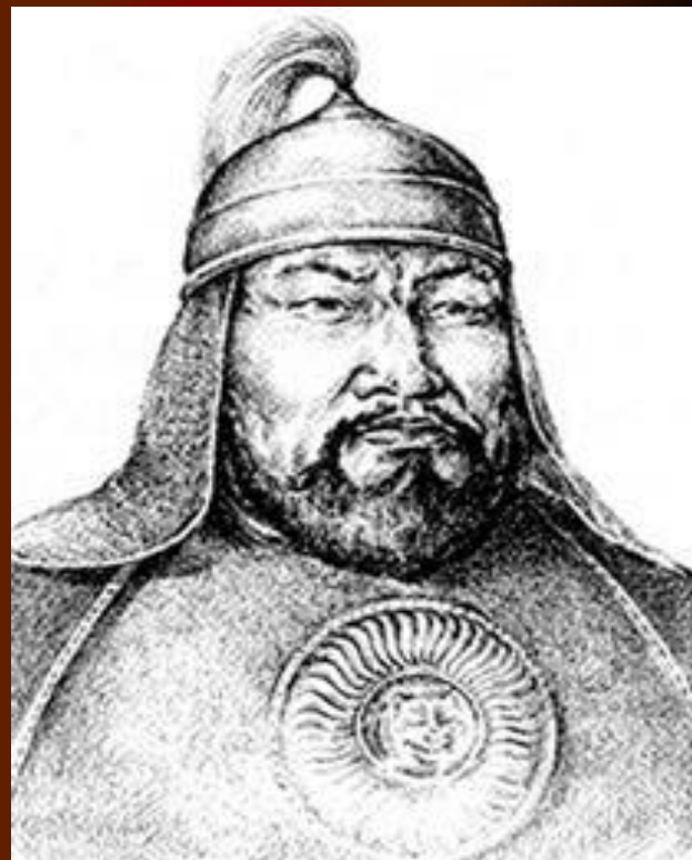
Кабанбай Батыр (ок.1691/2 – ок.1769/70 гг.)