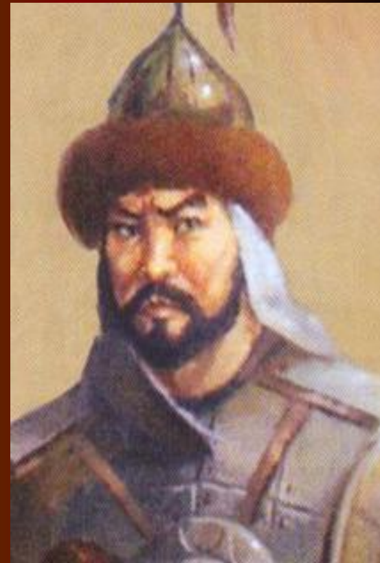
Жанибек Батыр (1693–1752 гг.)