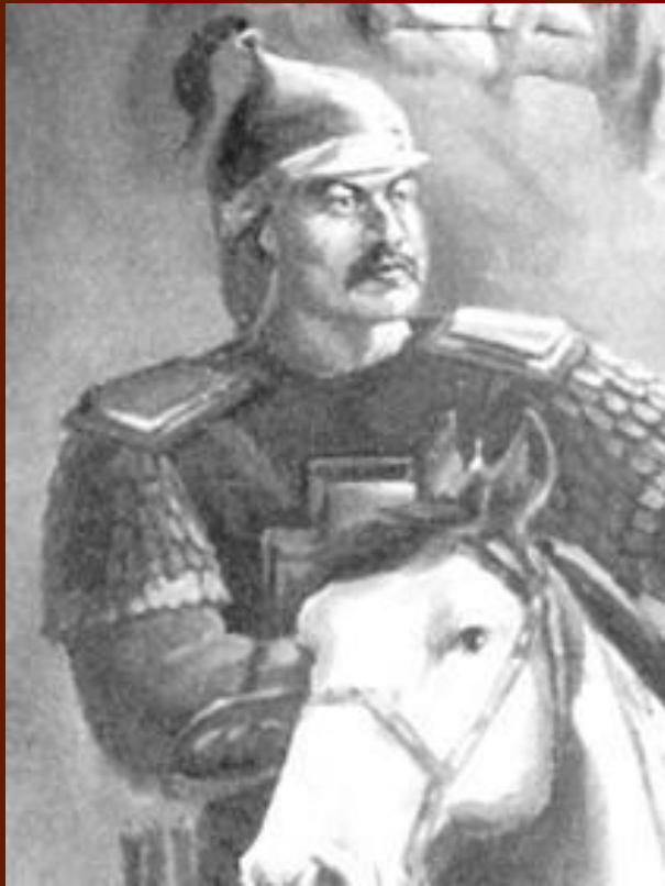
Наурызбай Куттымбетулы Батыр (1706–1781 гг.)