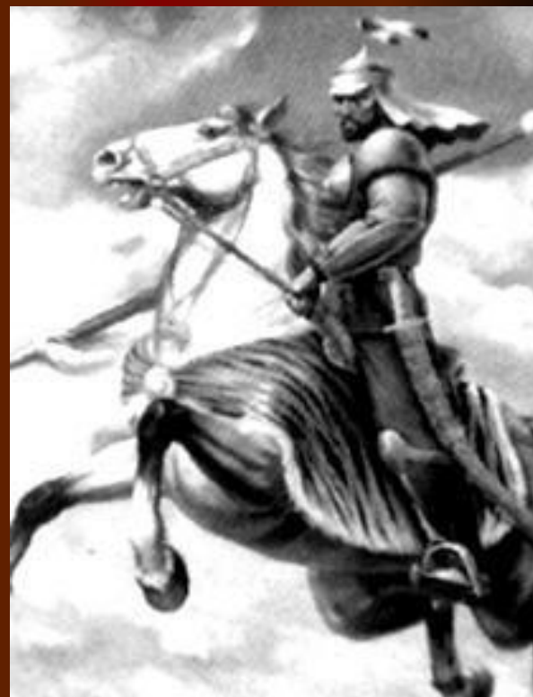
Карасай Батыр (1598–1671 гг.)