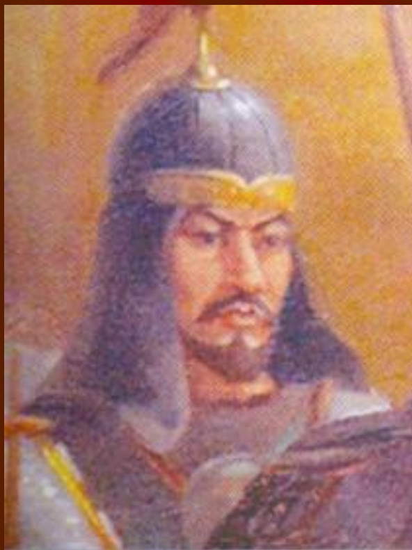
Райымбек Батыр (1705 – точная дата смерти неизвестна)