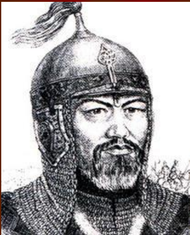
Богенбай Батыр (1690–1775 гг.)