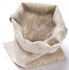
Гроші на кредит

вартість, яка надається в позику з метою отримання прибутку (процента).