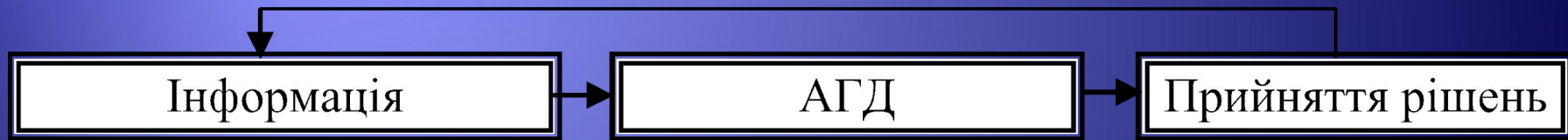
Рис. 4. Місце АГД в процесі прийняття управлінських рішень

АГД займає проміжне місце, виступаючи як зв'язкова ланка між інформаційним етапом і етапом прийняття рішень, тим самим впливаючи на якість прийнятих управлінських рішень.