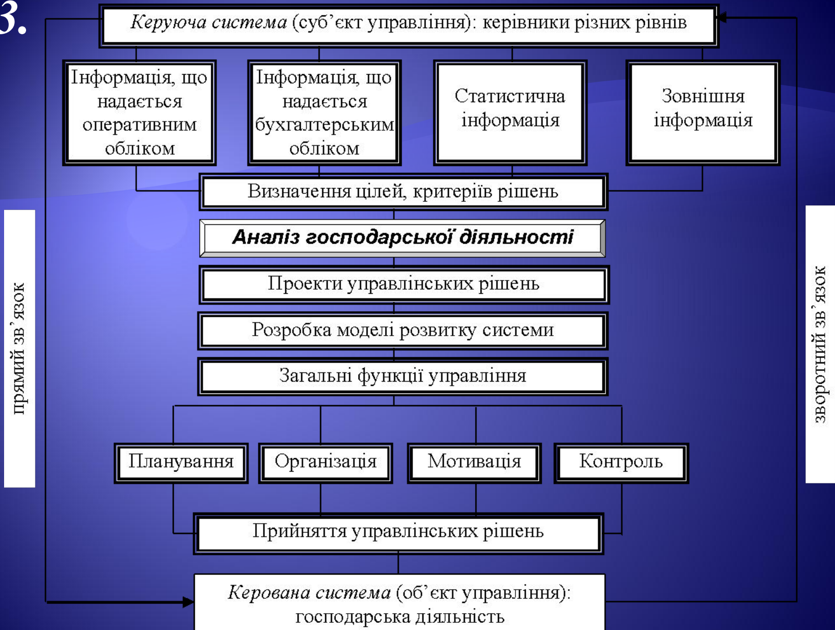
Рис. 3. Місце аналізу господарської діяльності в управлінні