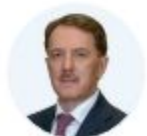
КУРАТОР А. В. ГОРДЕЕВ Заместитель Председателя Правительства РФ