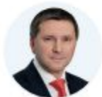
РУКОВОДИТЕЛЬ Д. Н. КОБЫЛКИН Министр природных ресурсов и экологии РФ