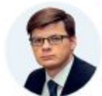
АДМИНИСТРАТОР Д. Г. ХРАМОВ Первый заместитель Министра природных ресурсов и экологии РФ

обеспечение баланса выютия и воспроизводства лесов в соотношен