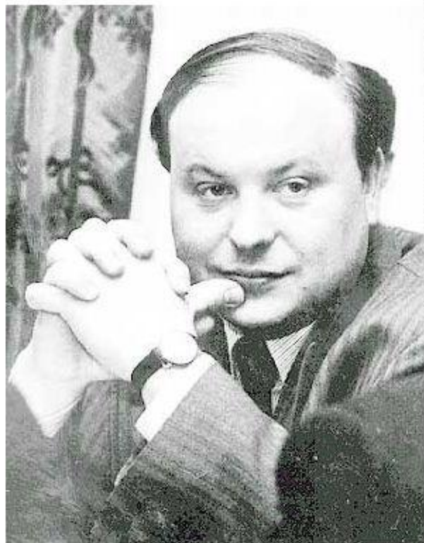
Егор Тимурович Гайдар

Цены на многие товары выросли сразу в 10-12 раз , а к концу 1992 г. - в среднем в 25 раз .