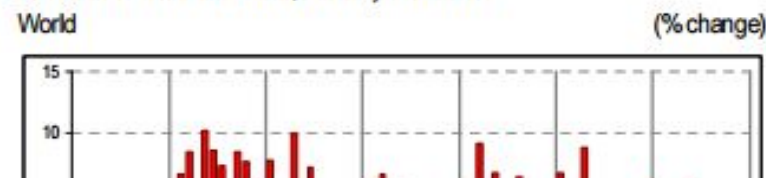
International Tourist Arrivals, monthly evolution