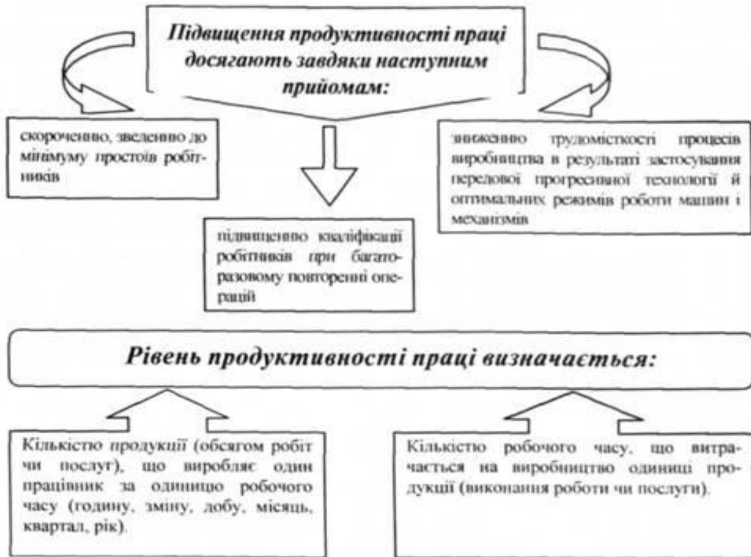
Рис. 1. Рівень продуктивності праці