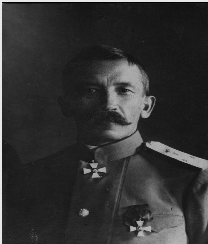
Лавр Георгиевич Корнилов