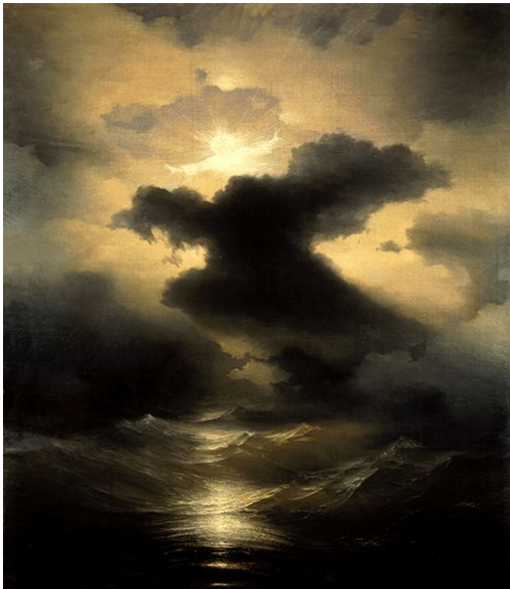
«Хаос. Сотворение мира»

В 1840 году Айвазовский направляется по заданию Академии в Италию. Там он много и плодотворно работает, изучает классическое искусство. В Риме и других европейских городах проходят успешные выставки его работ. Его полотна, выставленные на римской выставке, привлекли к себе всеобщее внимание. Папа римский Григорий XVI приобретает для картинной галереи Ватикана картину «Хаос». Гоголь шутил по этому поводу: «Пришел ты, маленький человек с берегов Невы в Рим и сразу поднял Хаос в Ватикане».