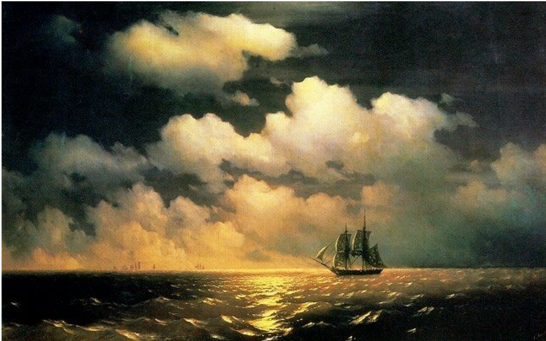
«Бриг Меркурий после боя»