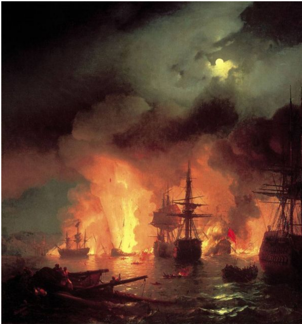
«Чесменский бой в ночь с 25 на 26 июня 1770 года» 1848 г.