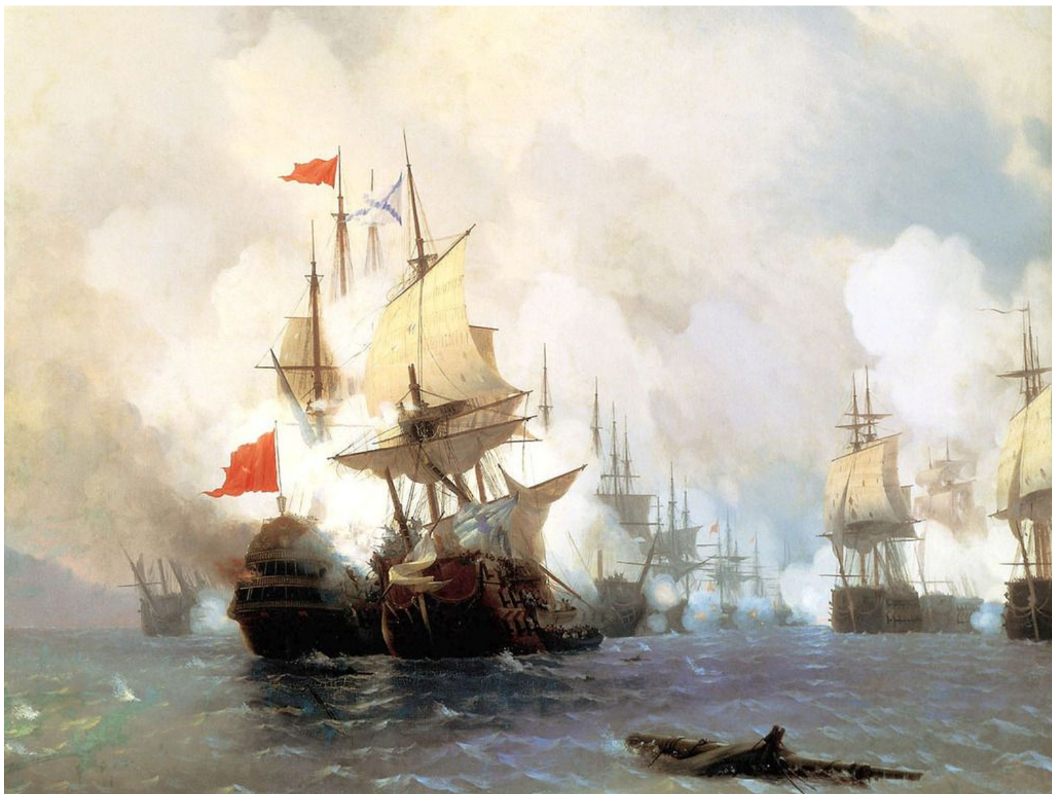
«Бой в Хиосском проливе 24 июня 1770 года» 1848.