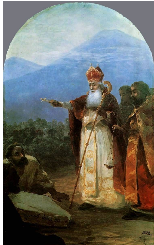
"Крещение армянского народа"