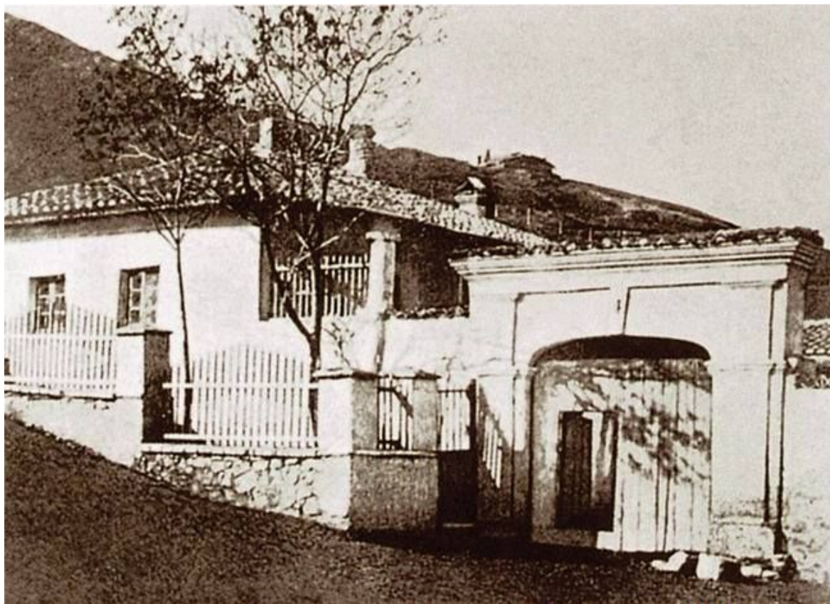
Дом Айвазовских в Феодосии