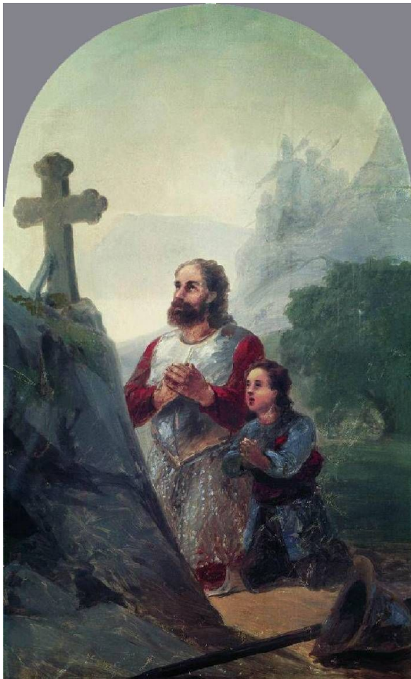
"Клятва. Полководец Вардан"

Айвазовский создал целый ряд картин на библейские, а также исторические сюжеты.