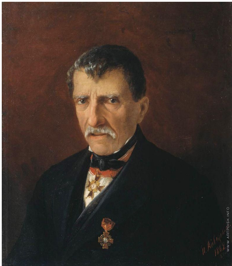
Портрет новонахичеванского городского головы А. Халибяна