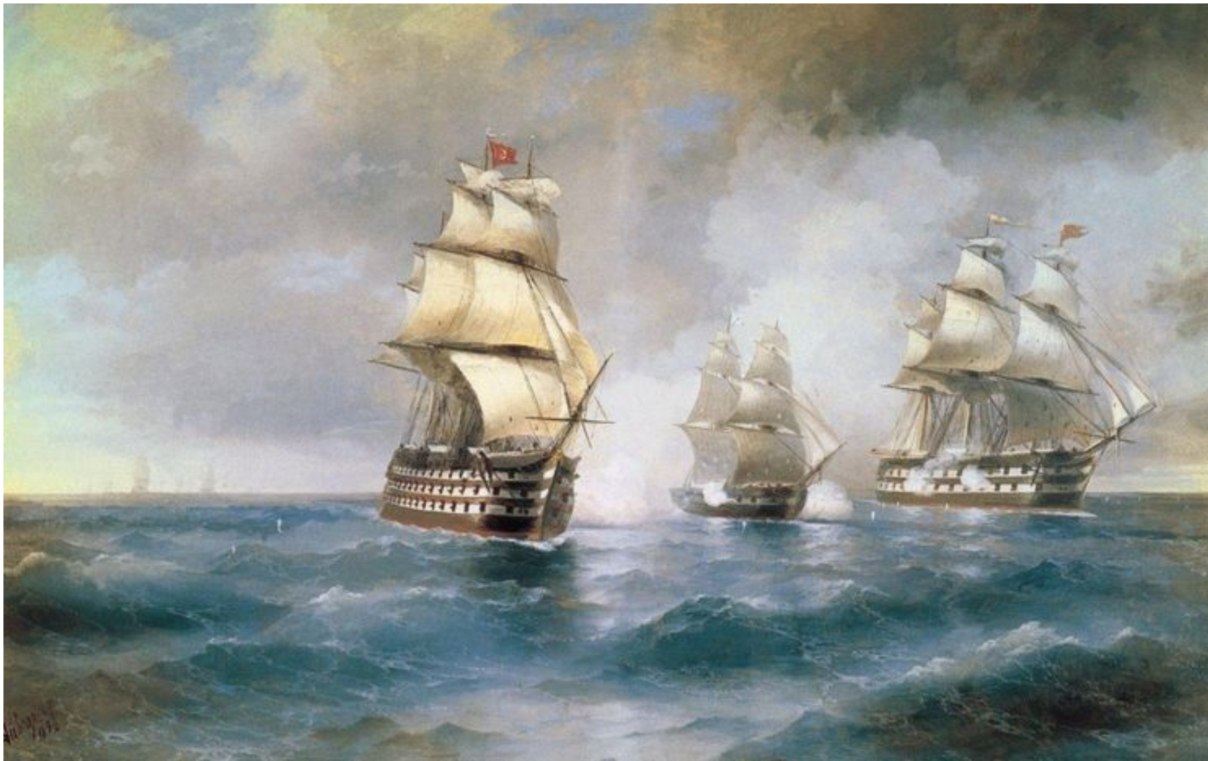
«Бриг Меркурий, атакованный двумя турецкими кораблями»