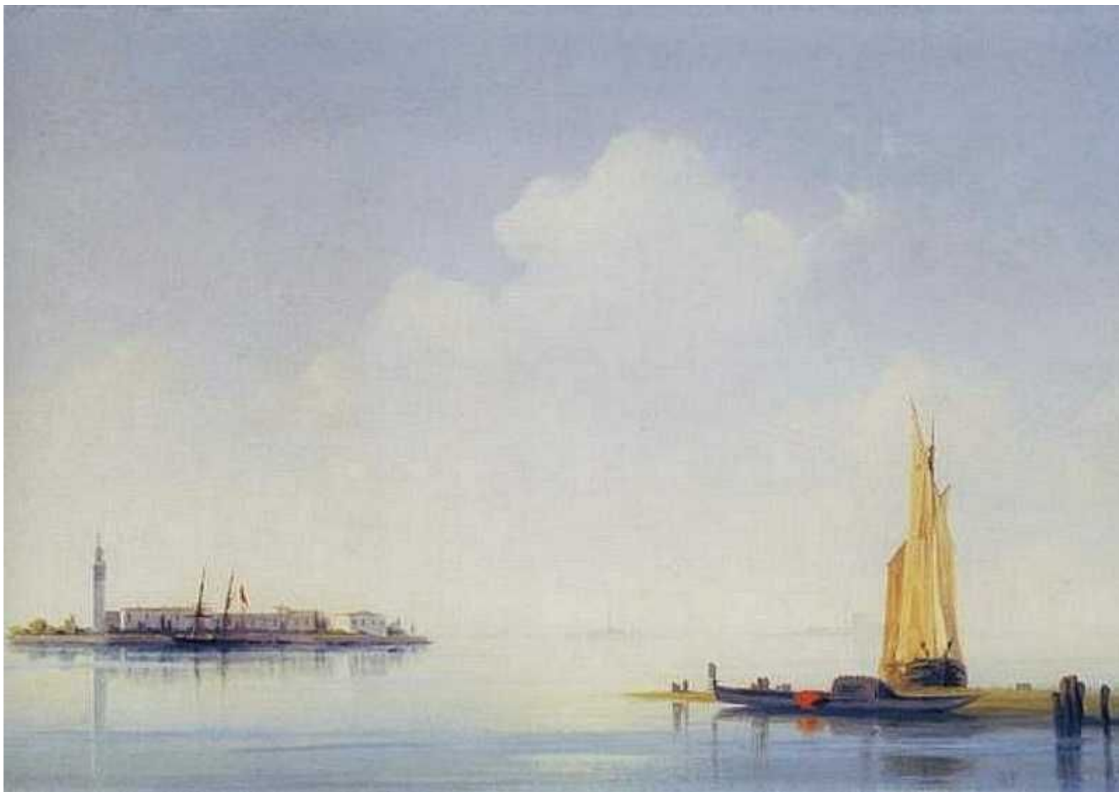
«Венецианская лагуна. Вид на остров Сан-Джорджо» 1844г.