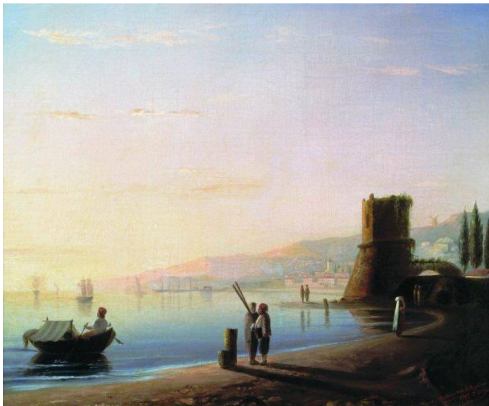
Пристань в Феодосии 1840.

Однако первоначально молодого художника командировали в Крым писать виды приморских городов. Плавая на боевых кораблях, Айвазовский близко познакомился с адмиралами М. Лазаревым, Ф. Литке, В. Корниловым, П. Нахимовым, П. Панфиловым, проникся глубокой верой в силу русского флота и стал впоследствии непревзойденным певцом его побед. Поручение академии было с успехом выполнено.