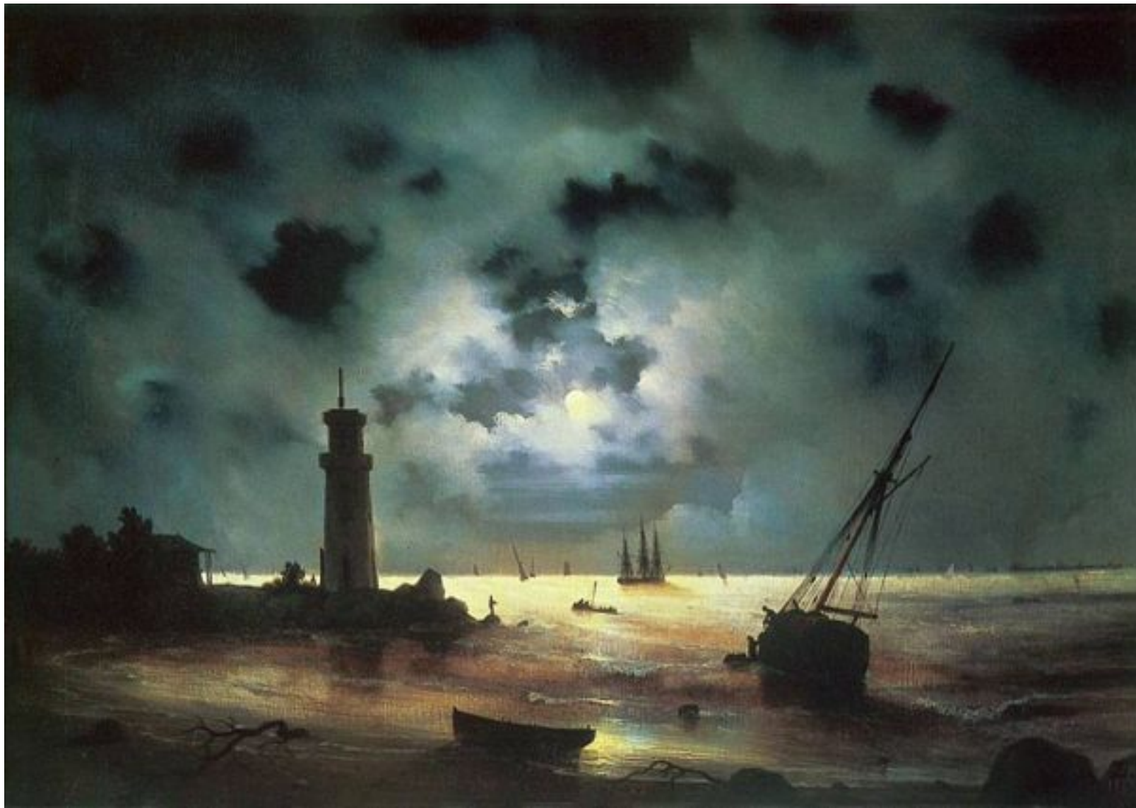
«Берег моря ночью. У маяка» 1837г.