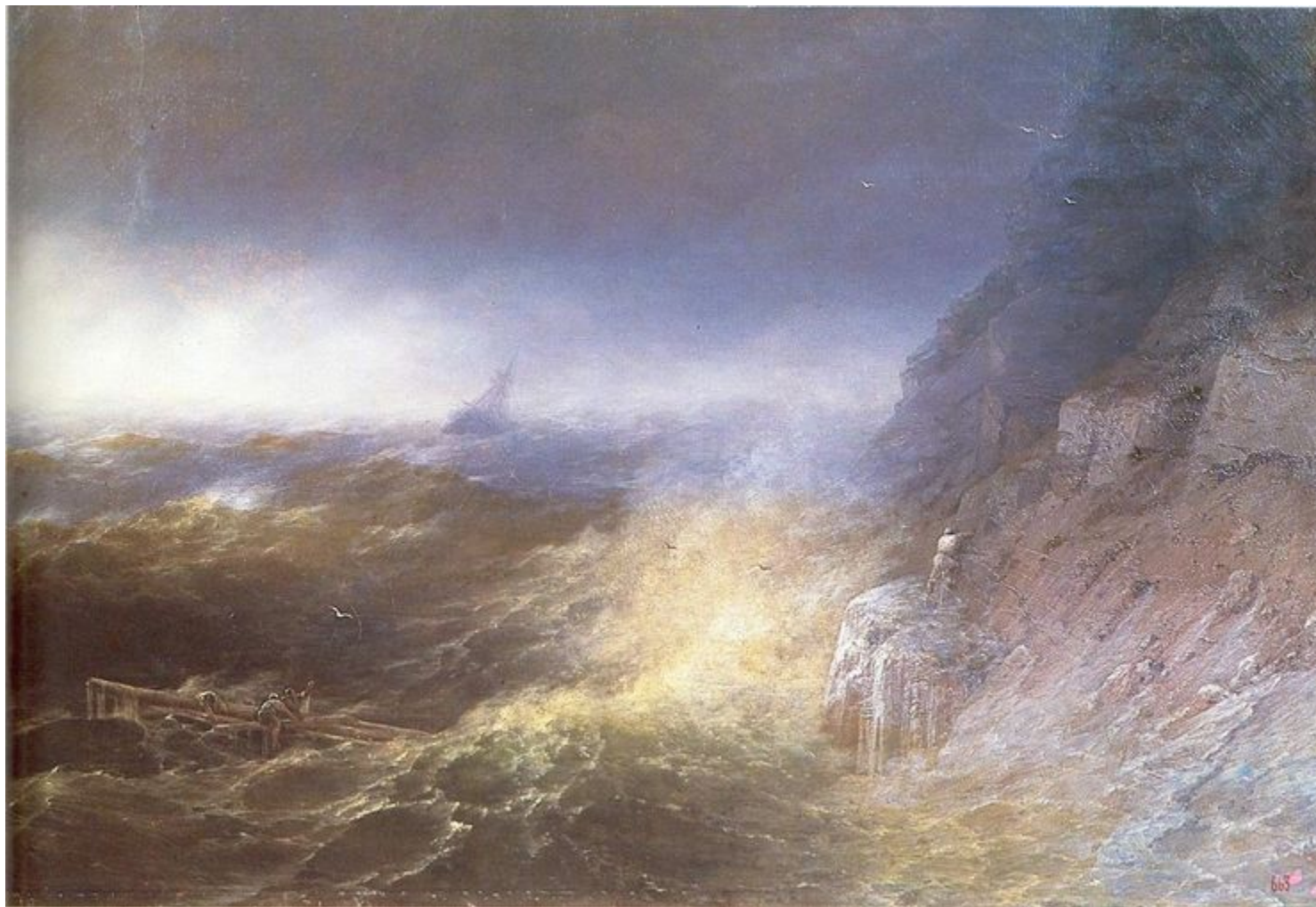
«Буря на Чёрном море»

Айвазовский был последним и самым ярким представителем романтического направления в русской живописи.