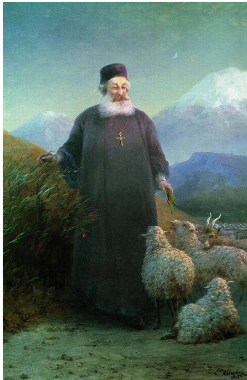
Портрет католикоса Хримяна