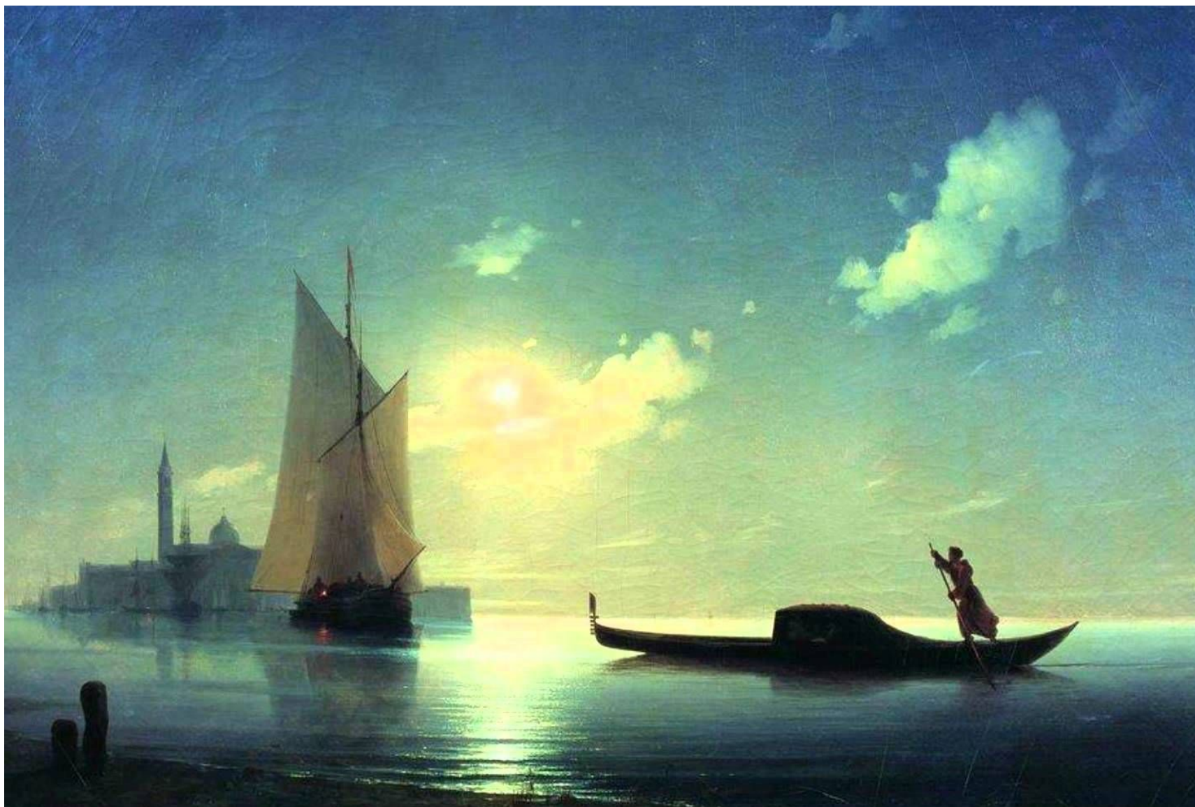
«Гондольер на море ночью» 1843.