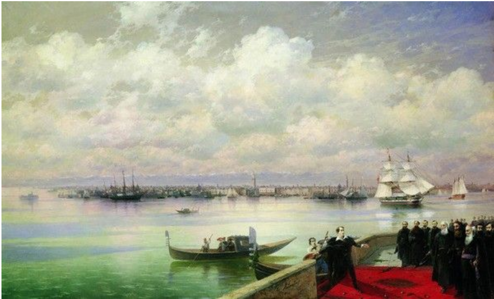
"Приезд Байрона на остров св. Лазаря"

В самом конце жизни, организовав в Петербурге последнюю свою выставку, художник решил поехать в Италию: "Мое начало озарено этой страной, и теперь я снова хочу встретиться со своей молодостью" .