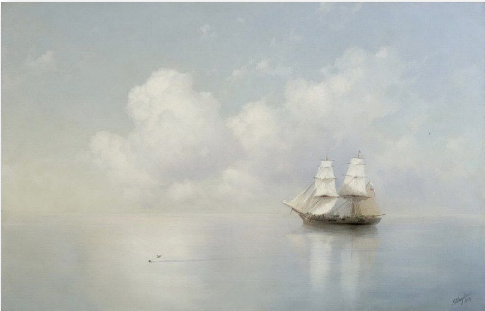
«Штиль в Финском заливе» 1837г.