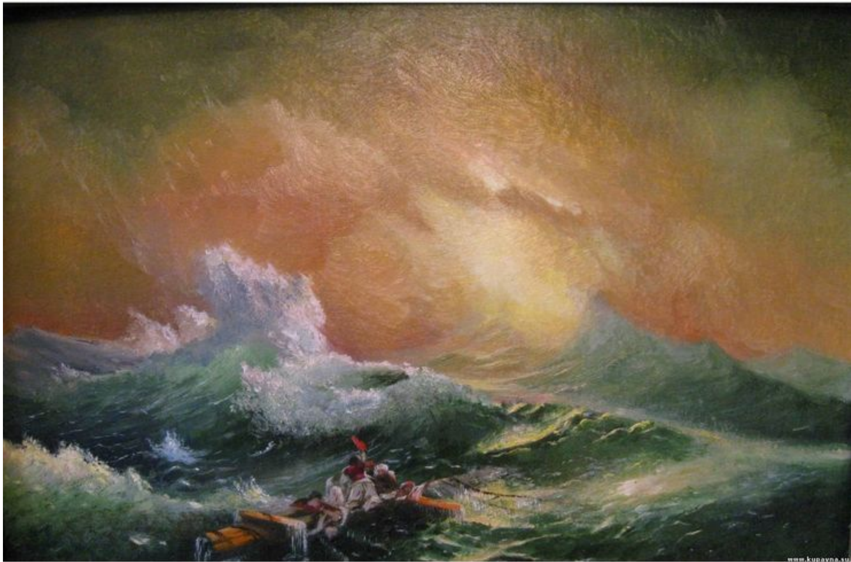
«Девятый вал» 1850