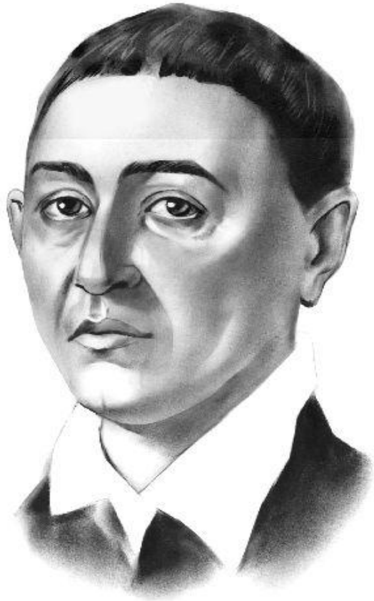
Григорій Сковорода (1722—1794)

Цікаві факти та історії, які дозволять побачити відомого філософа у новому, цікавому світлі.