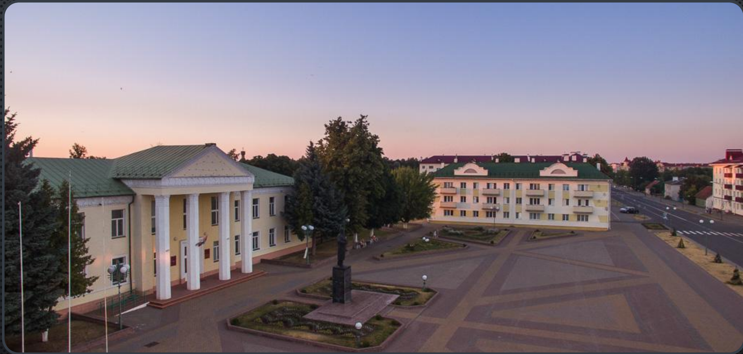
ЦЕНТР Г. БЕРЕЗА