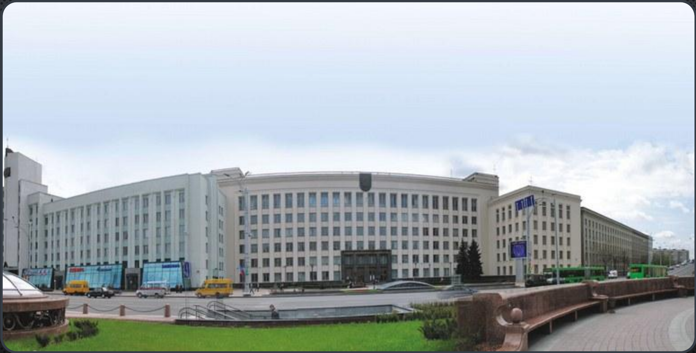
ФАКУЛЬТЕТ ЖУРНАЛИСТИКИ БГУ