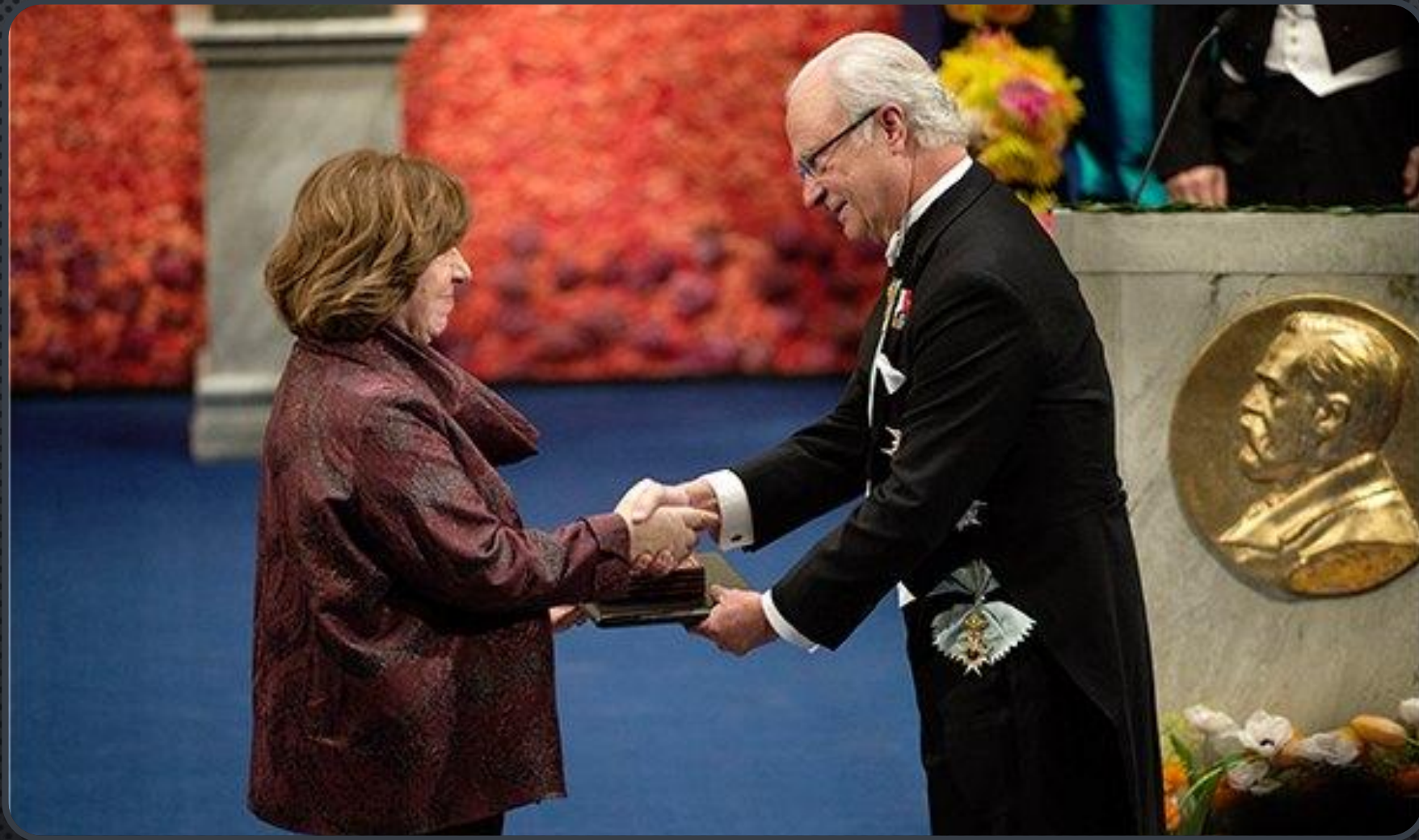
СВЕТЛАНА АЛЕКСИЕВИЧ ПОЛУЧАЕТ НОБЕЛЕВСКУЮ ПРЕМИЮ ПО ЛИТЕРАТУРЕ ИЗ РУК КОРОЛЯ ШВЕЦИИ КАРЛА XVI ГУСТАВА 10 ДЕКАБРЯ 2015