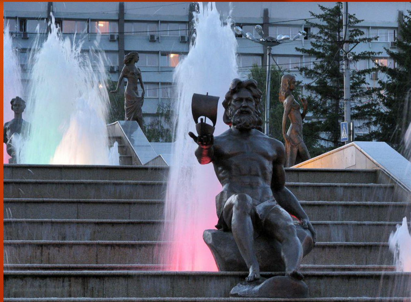
Фонтан «Реки Сибири»