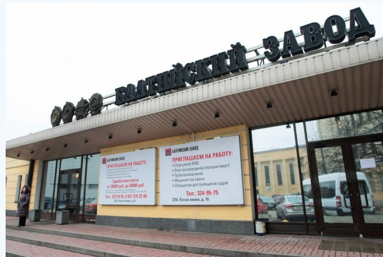
Балтийский судостроительный завод