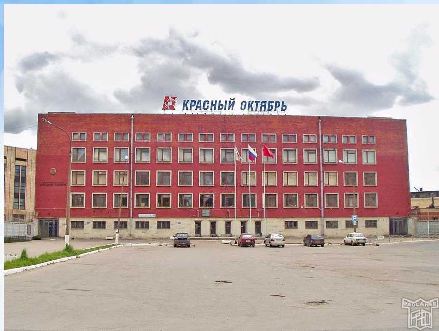
«Красный Октябрь» (СПб)

Оборонная промышленность практически полностью сконцентрирована в Санкт-Петербурге и Калининграде и выпускает авиационную и ракетно-космическую технику, артиллерийское и стрелковое вооружение, танки, военные корабли, радиоэлектронику.