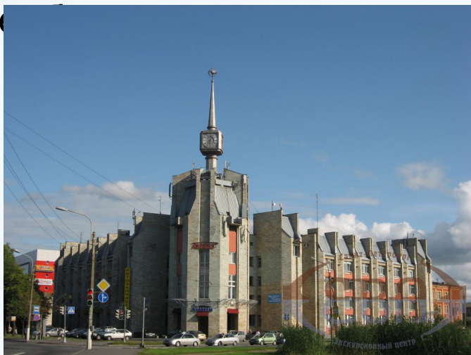
Часовой завод «Ракета» (Петродворец)

Машиностроение — главная отрасль хозяйства региона. Наиболее развито железнодорожное машиностроение (Санкт-Петербург), судостроение (Санкт-Петербург, Выборг и Калининград), энергетическое машиностроение (Санкт-Петербург и Колпино), оптико-механическая (Санкт-Петербург), электротехническая промышленность (Санкт-Петербург и Великий Новгород), приборостроение (Санкт-Петербург), часовая промышленность (Петродворец), тракторостроение (Санкт-Петербург), быстро развивается автосборка в Калининграде, Всеволожске и Санкт-Петербурге.