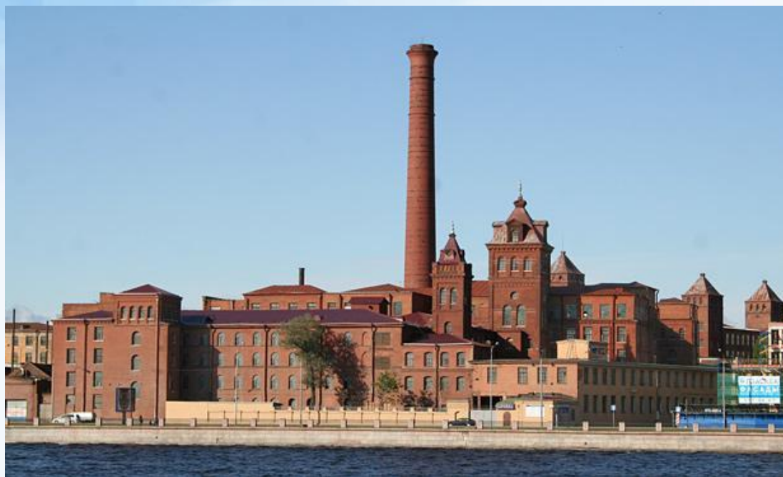
Прядильно-ниточный комбинат «Красная нить» (СПб)

Лёгкая промышленность , переживающая тяжелейший упадок, представлена текстильной (Санкт-Петербург, Великий Новгород, Великие Луки), швейной и обувной промышленностью (Санкт-Петербург).