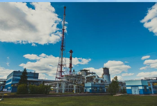
ПГ "Фосфорит" (Кингисепп)

Химическая промышленность — вторая по значению отрасль промышленности региона выделяется развитием нефтеперерабатывающей промышленности (Кириши), тонкой химии (Санкт-Петербург), производством фосфорных (Кингисепп) и азотных (Великий Новгород и Калининград) удобрений.