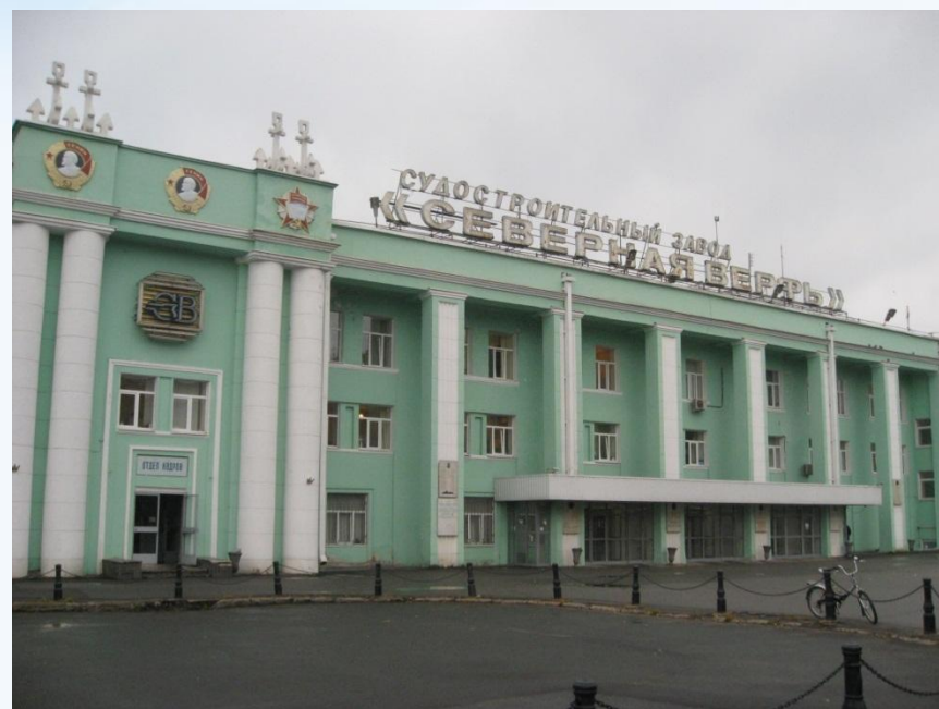
«Северная Верфь» (СПб)