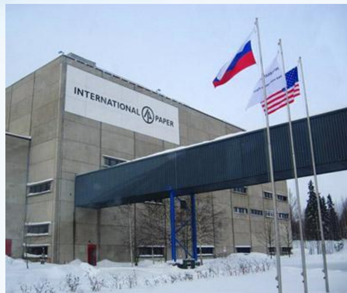
Целлюлозно-бумажный комбинат (Светогорск)