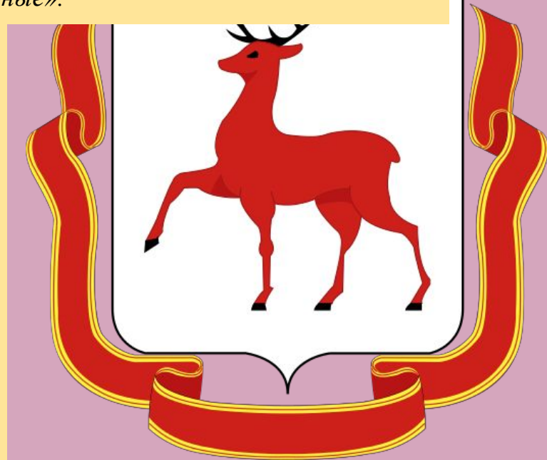
Герб Нижнего Новгорода

«Флаг города Нижнего Новгорода представляет собой прямоугольное полотнище белого цвета с соотношением ширины к длине 2:3. В центре полотнища расположена фигура из герба города Нижнего Новгорода высотой 4/5 ширины флага: идущий к древку червлёный олень, рога, глаза и копыта чёрные».