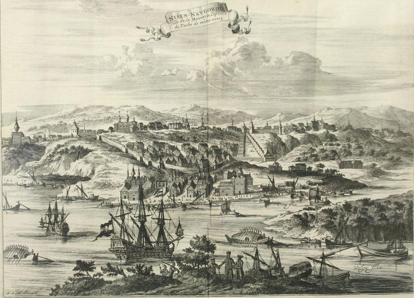
Нижний Новгород на гравюре Питера ван дера Аа 1727 года.