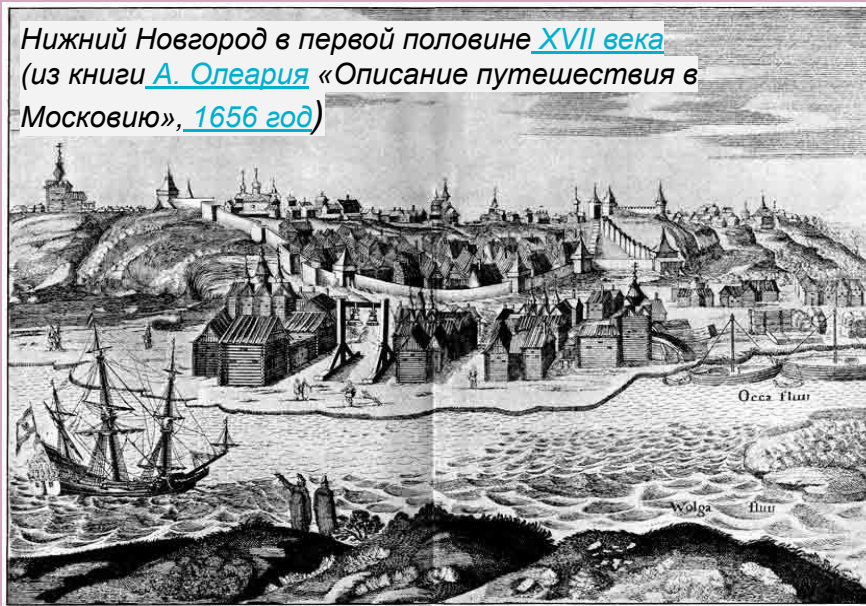
Нижний Новгород в первой половине XVII века (из книги А. Олгария «Описание путешествия в Московию», 1656 год )