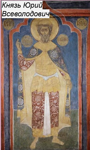
Князь Юрий Всеволодович