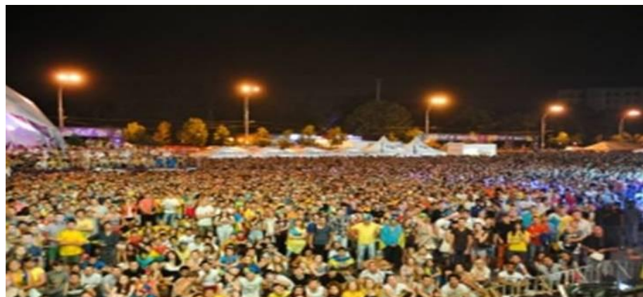
Таблиця 41. Структура зайнятості в матеріальному виробництві в Північно Східному економічному районі, %

В Північно-Східному районі налічується 47 міст та 101 селище міського типу. Рівень урбанізації в районі становить 72%. Рівень зайнятості досягає 55%. Переважна більшість населення зайнята у матеріальному виробництві