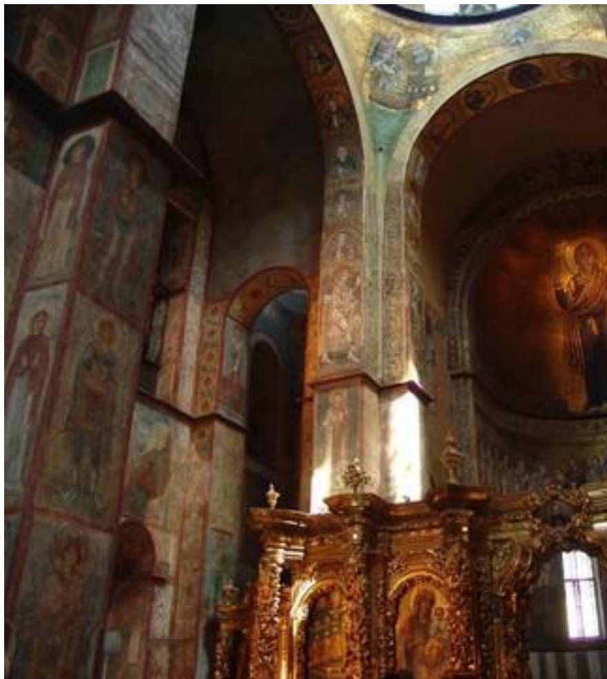
Софійський собор всередині