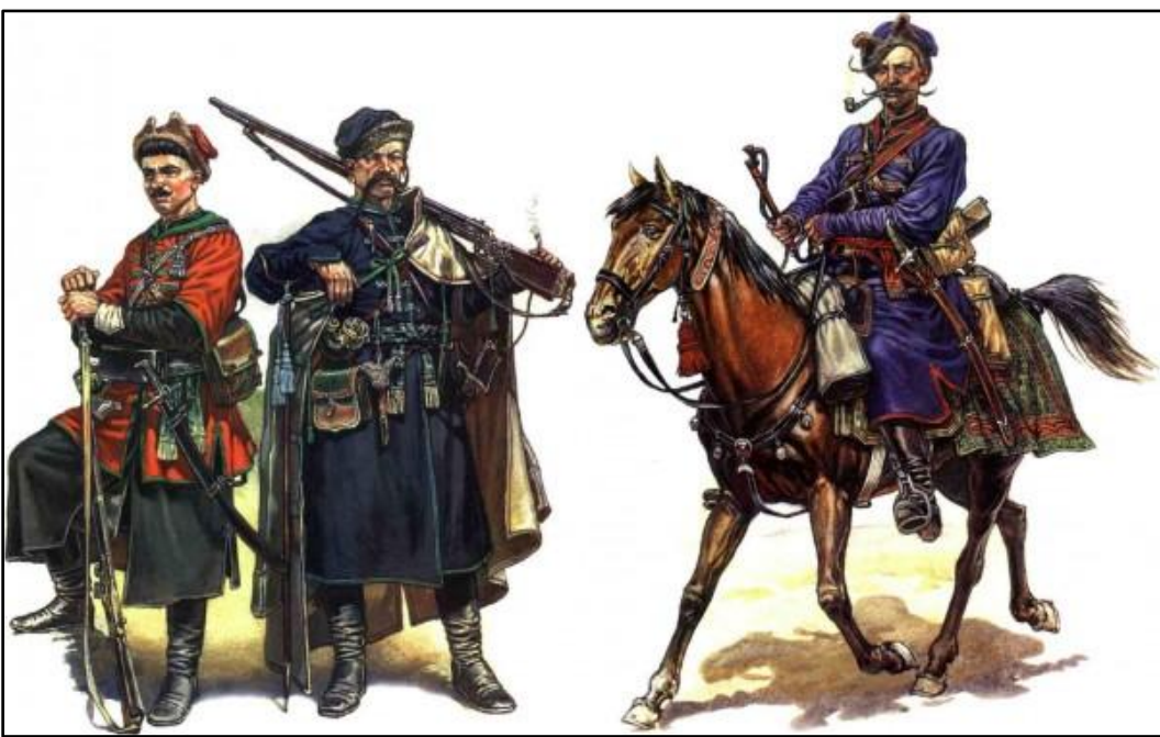
Козаки. Перша письмова згадка – 1489 рік