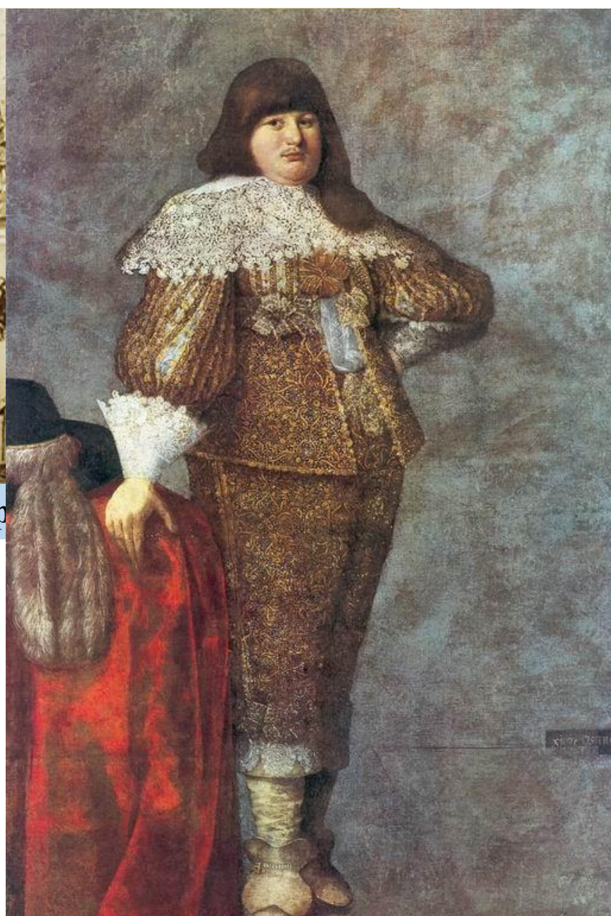
Польський шляхтич Владислав Домінік Заславський

Польський король Стефан Баторій в 1578 році створив перший козацький реєстр (список, в який записали козаків, прийнятих на службу до короля). Саме з цього моменту козаки стали окремим станом в такій державі як Річ Посполита