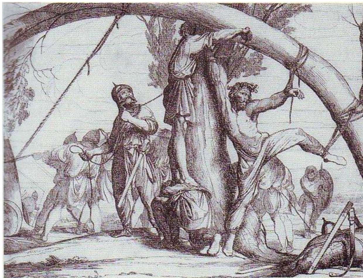
Смерть князя Ігоря від рук древлян в 945 році