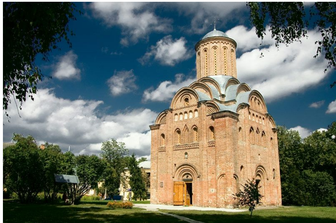
П'ятницькій собор в Чернігові