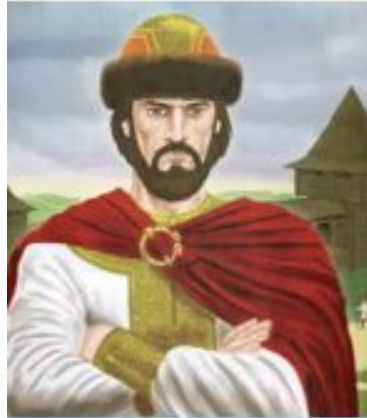
Князь Ігор. Загинув в 945 році від рук древлян