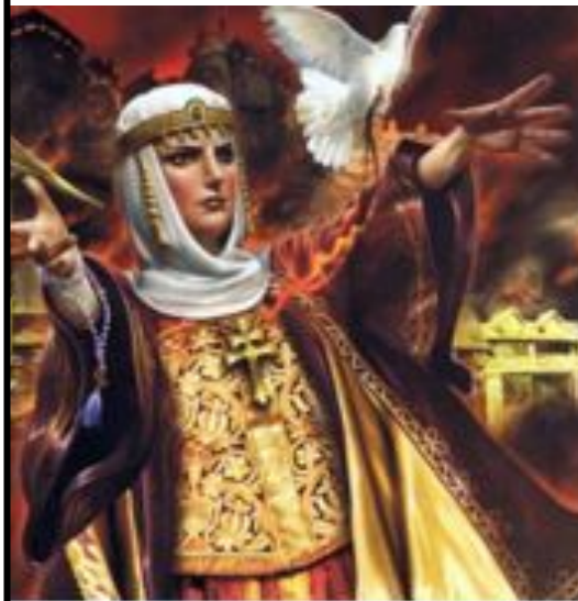
Княгиня Ольга. Помстилася древлянам за смерть чоловіка. Спалила Іскоростень

Визначте, які з цих станів мали подібний спосіб життя, матеріальне становище, заняття. Як ви це встановили?