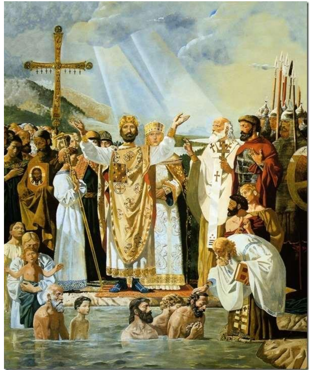
Хрещення Русі Володимиром Великим . 988 рік