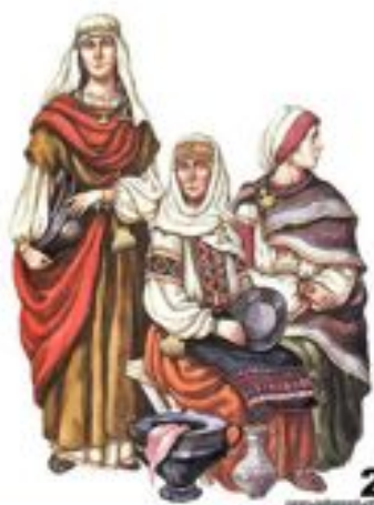
Смерди – вільні селяни - общинники