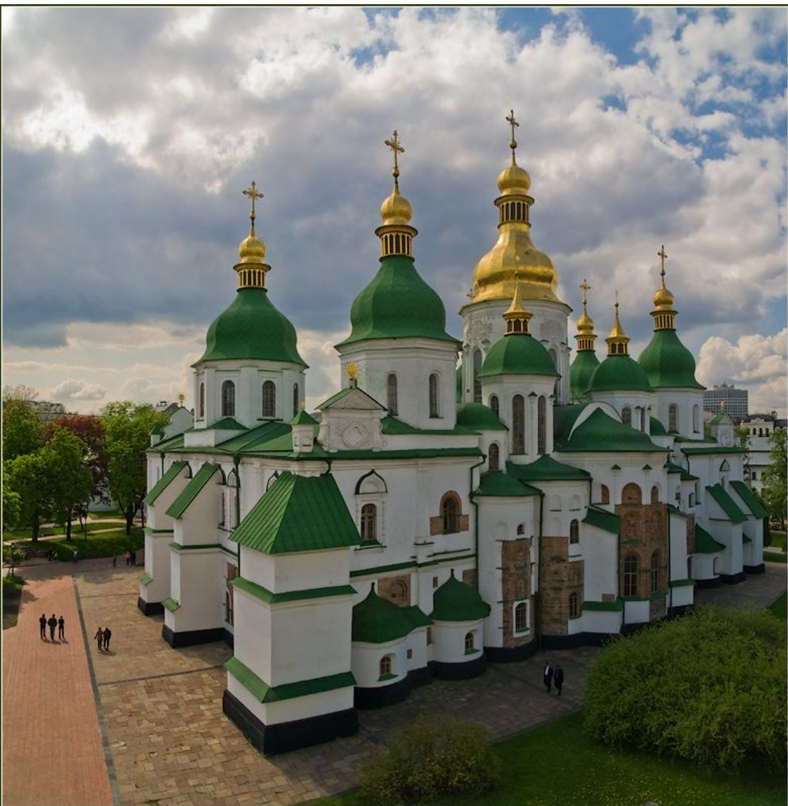
Софійський собор 1017 – 1037 рр.