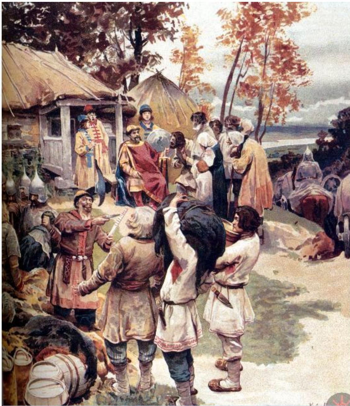
Збір данини на Русі - полюддя