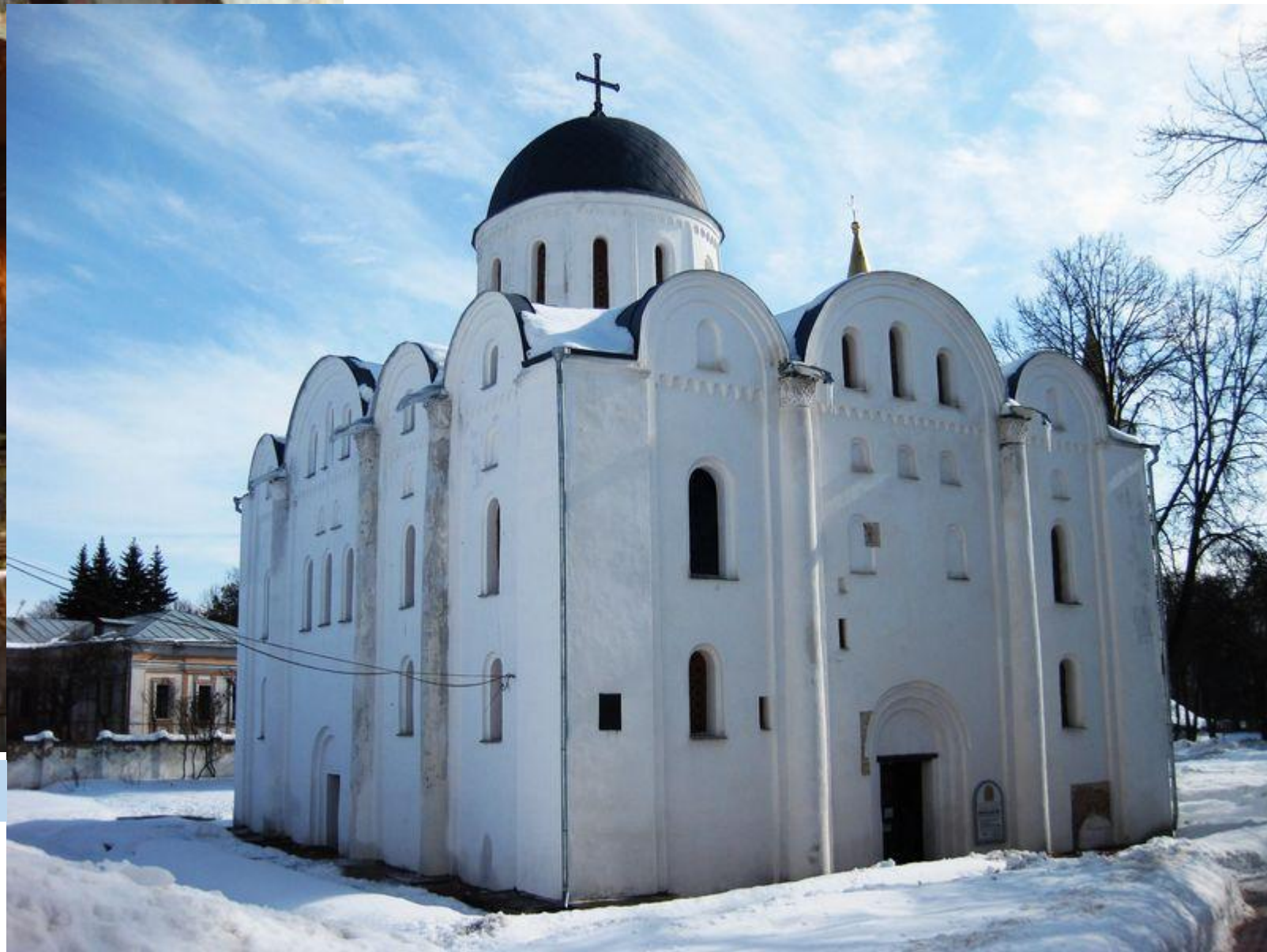
Борисоглібський собор в Чернігові