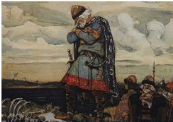
Князь Олег – Віщий. В 882 році він утворив державу східних слов'ян з центром у Києві