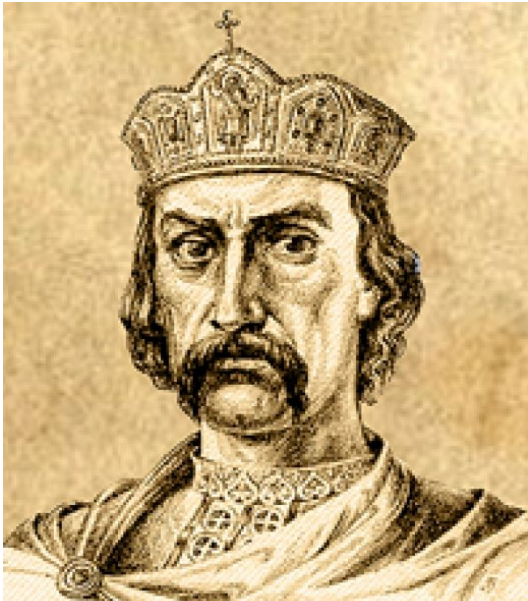
Володимир Великий . Київський князь 980 – 1015рр.