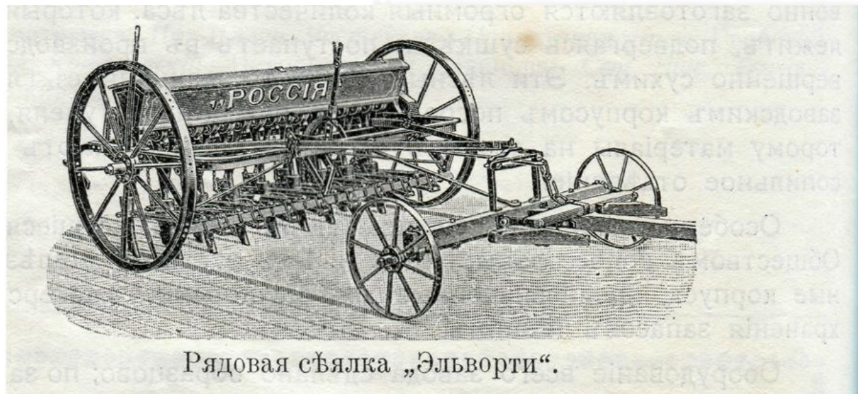
Рядовая сѣялка „Эльворти“.

В 19 столітті в Російській імперії відбувся промисловий переворот Він привів до появи досконаліших знарядь праці, поступово ручну працю замінила машинна