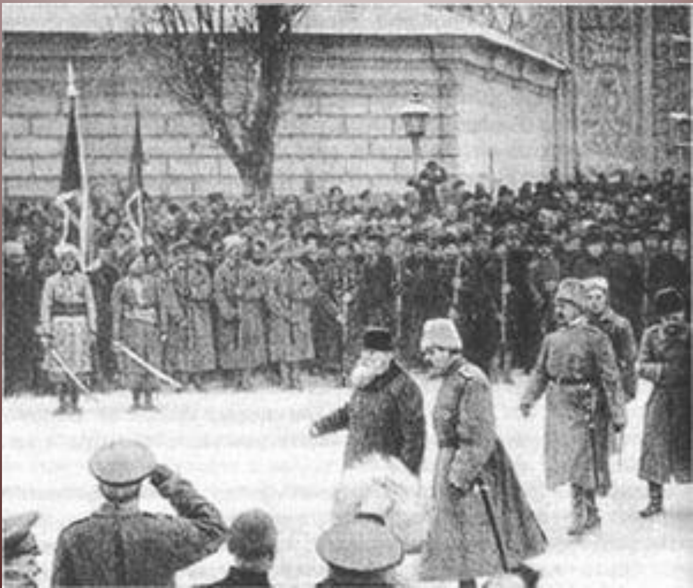
Весна 1917 р. Утворення підрозділів Вільного козацтва