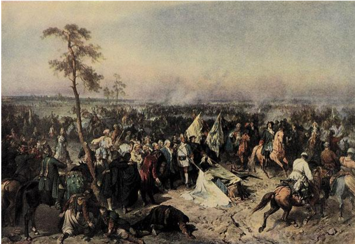
А.Е. Коцебу «Полтавская победа»