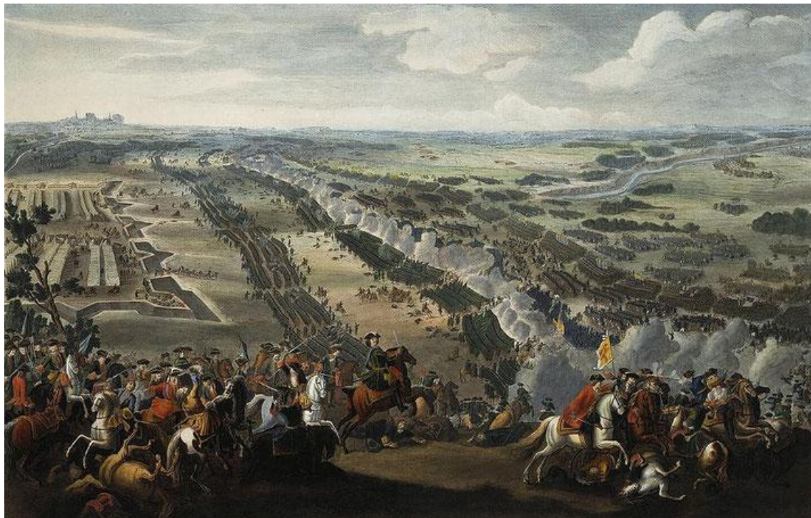
Д. Мартен «Полтавская битва»