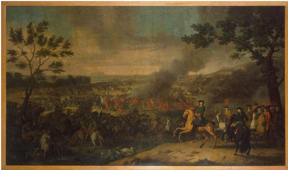
Л. Каравак «Пётр I в Полтавской битве»