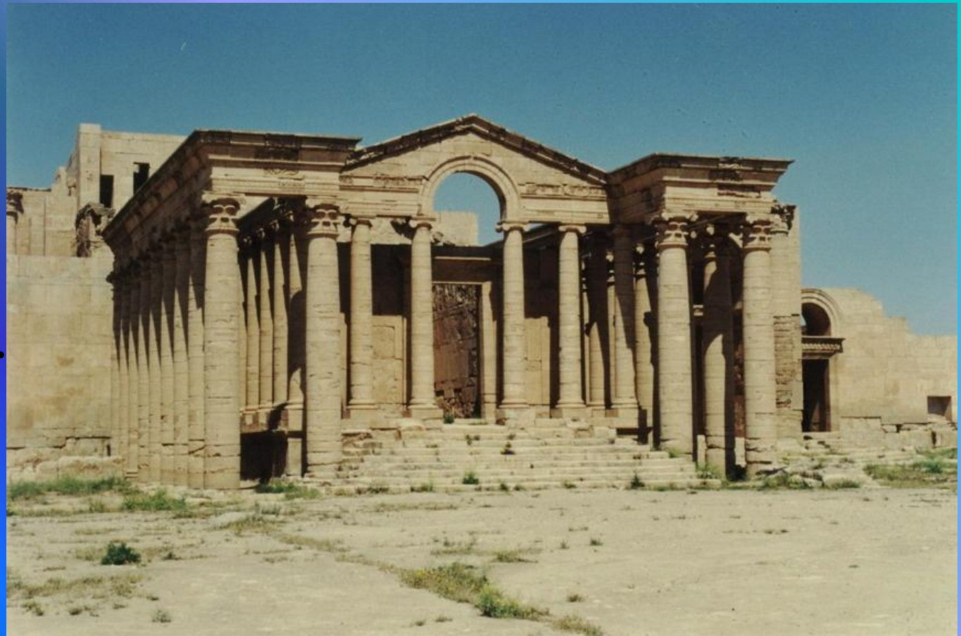
Храм Гармонии. Хатра (Ирак).

Гармония – красота, соразмерность: в архитектуре, состоянии души, человеческой фигуре.