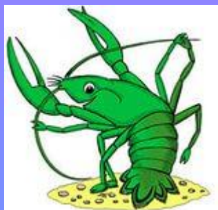
Рак - раки