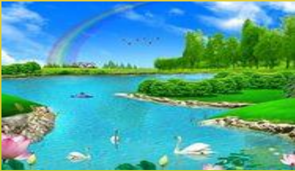
Река - реки