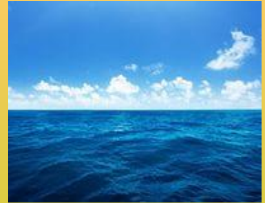
Океан - океаны