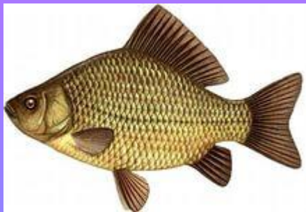
Карась - караси