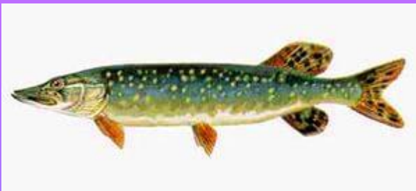
Щука - щуки