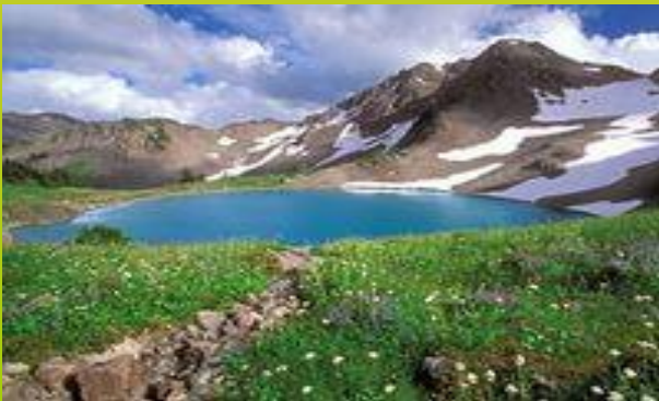
Озеро - озёра