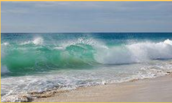
Море - моря