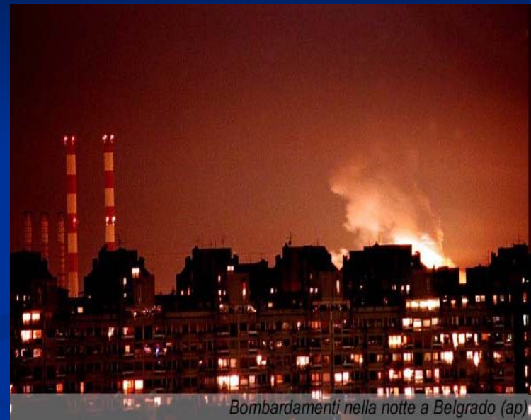
Bombardamenti nella notte a Belgrado

Руководство России осудило эти действия как агрессию и потребовало созыва Совета Безопасности ООН. Были прерваны отношения России с НАТО.