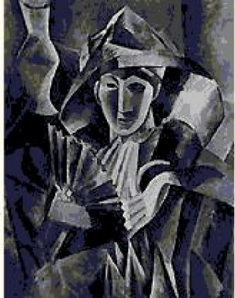
Пабло Пикассо. «Дама с веером»