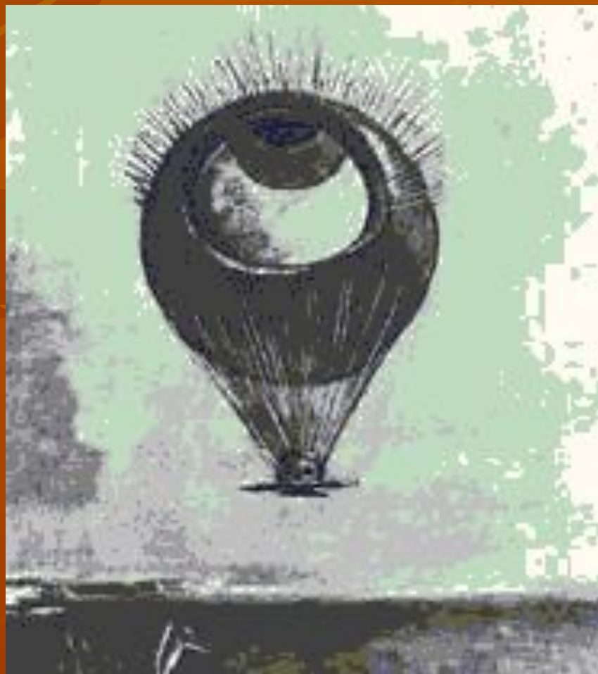
Одilon Редон. «Глаз как шар». Уголь. Около 1890.