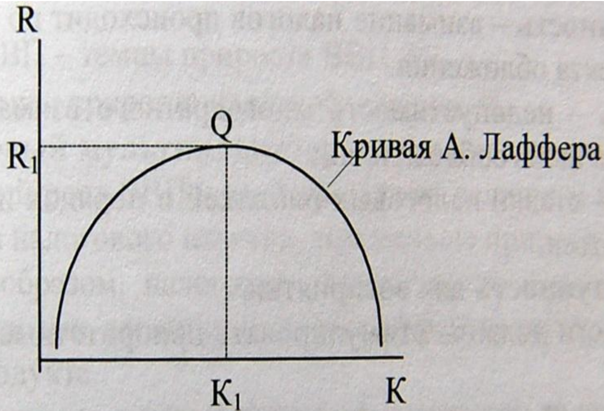
Рис. 54. Кривая Лаффера