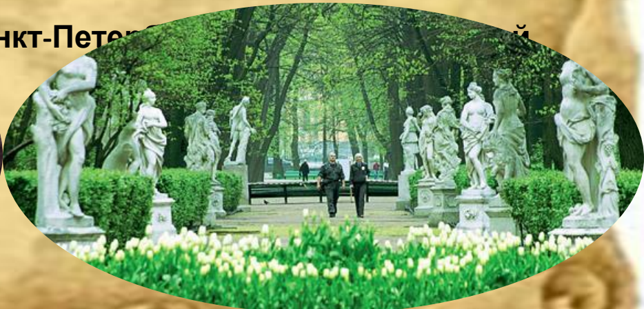
Летний сад Санкт-