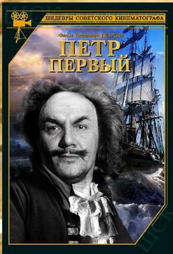
Кинематограф «Пётр I»