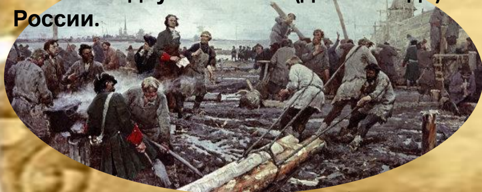
Начало строительства Санкт-

В течение двух столетий (до 1918 года) Санкт-Петербург был столицей России.