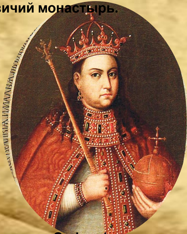
царевна Софья (сестра

ПЕТРА I Пётр был провозглашён царём в 1682 году в 10-летнем возрасте. Между ним и его сестрой Софьей шла борьба за престол. Большая часть войск поддержала законного царя, и царевне Софье пришлось признать поражение. Она сама отправилась в Троицкий монастырь, но в селе Воздвиженское её встретили посланники Петра с приказом вернуться в Москву. В августе 1689 Софья была отстранена от власти и заточена в Новодевичий монастырь.