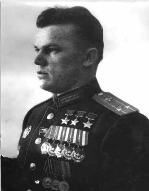
И. Н. Кожедуб