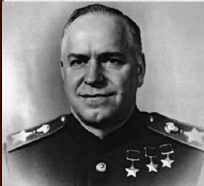
Г. К. Жуков