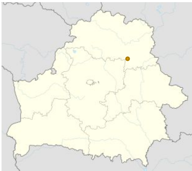
Высокі Гарадзец на карце Беларусі