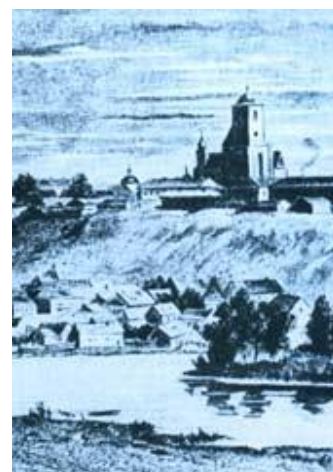
Магілёўская духоуная семінарыя