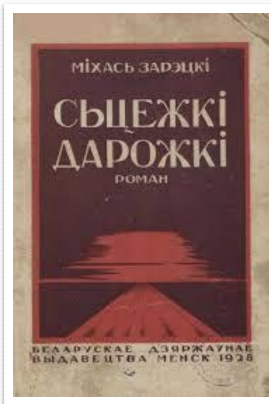
Вокладка кнігі «Сцежкі- дарожкі»