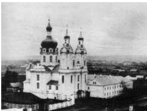
Аршанскае духоунае вучылішча