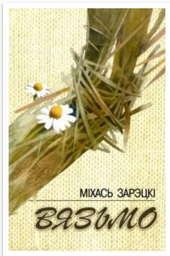
Вокладка кнігі «Вязьмо»