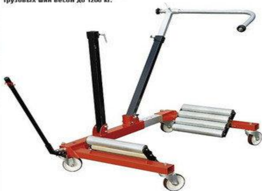
TW -1600. Тележка для транспортировки грузовых шин весом до 1200 кг.