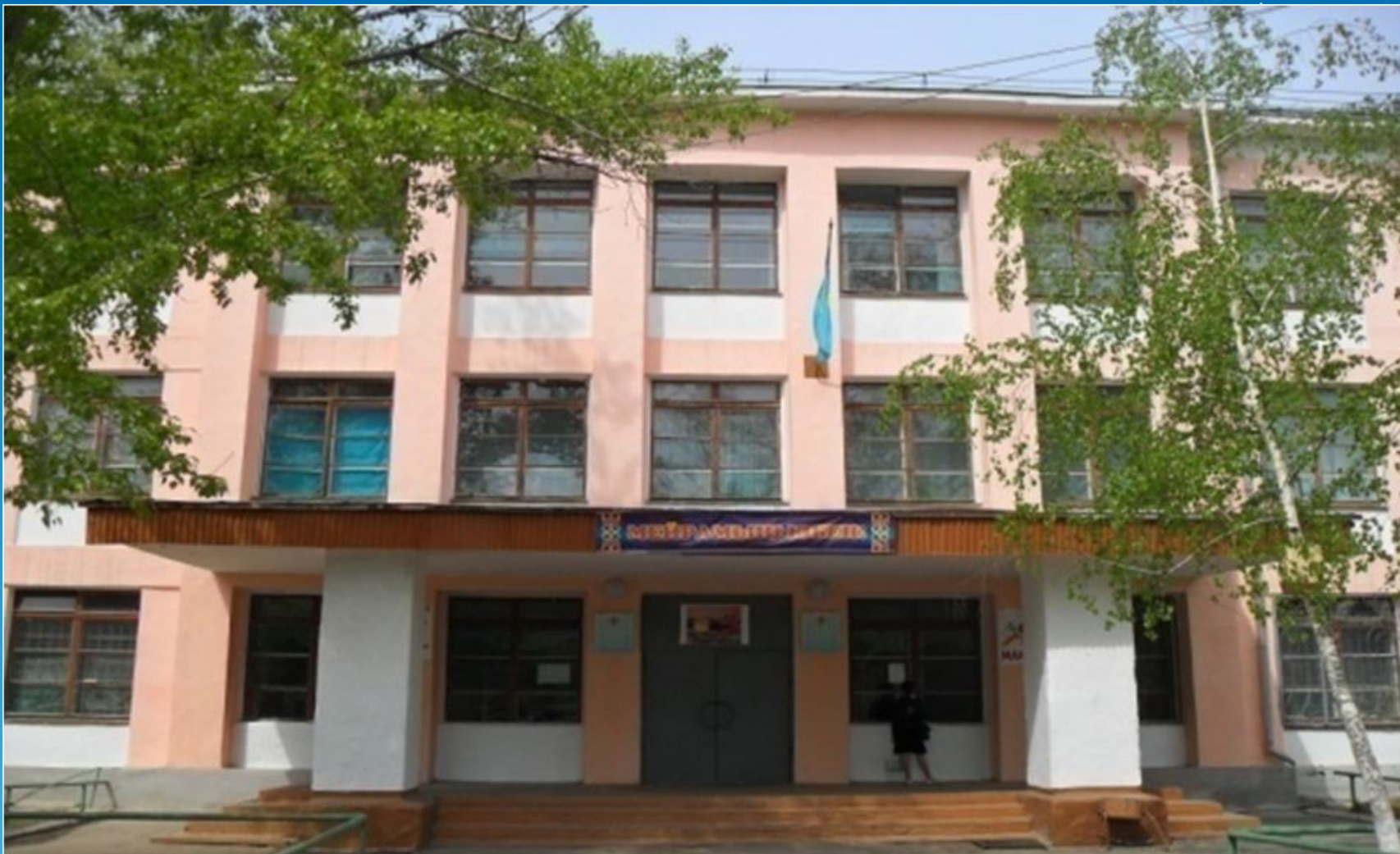
Қ. Нұрғалиев атындағы мектеп гимназиясы