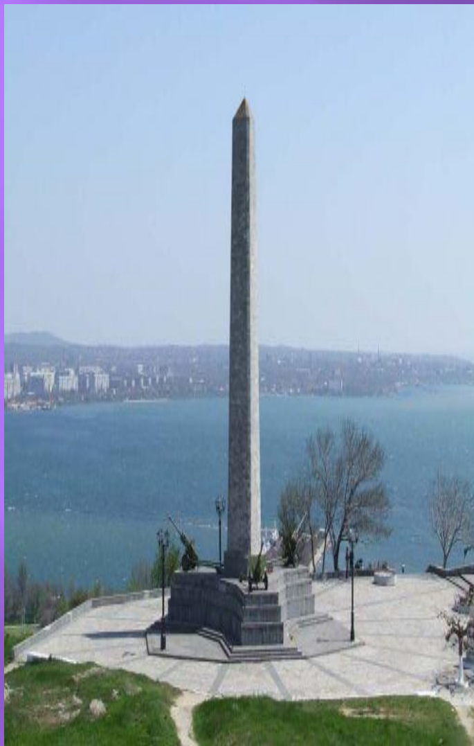
Обелиск Славы в Керчи.