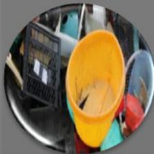
Пластмассы (полиэтилен и пластик)