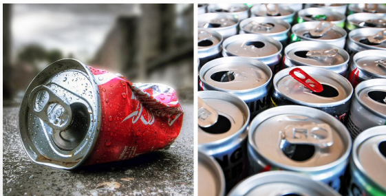
Алюминиевая банка – алюминиевая банка