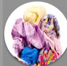
Текстиль (изношенная одежда, например)