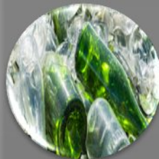
Стекло (стеклянная тара)