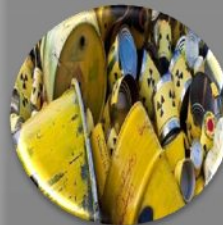
Металлы (черные и цветные, например, алюминиевые банки)