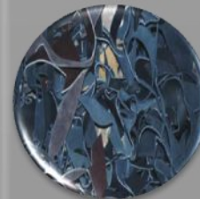
Другой мусор (древесина, резина, кожа)