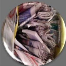
Макулатура (бумага, картон, упаковка, журналы и газеты)