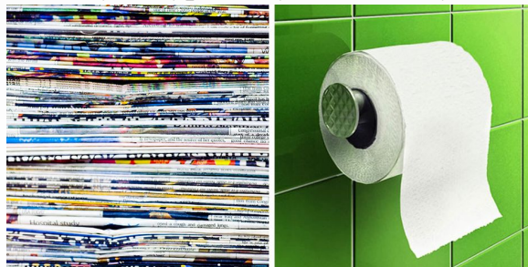
Макулатура – туалетная бумага