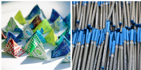
Упаковка Tetra Pak – шариковая ручка