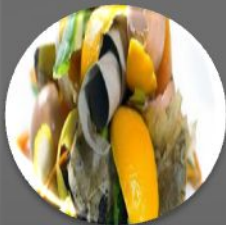
Пищевые и растительные отходы