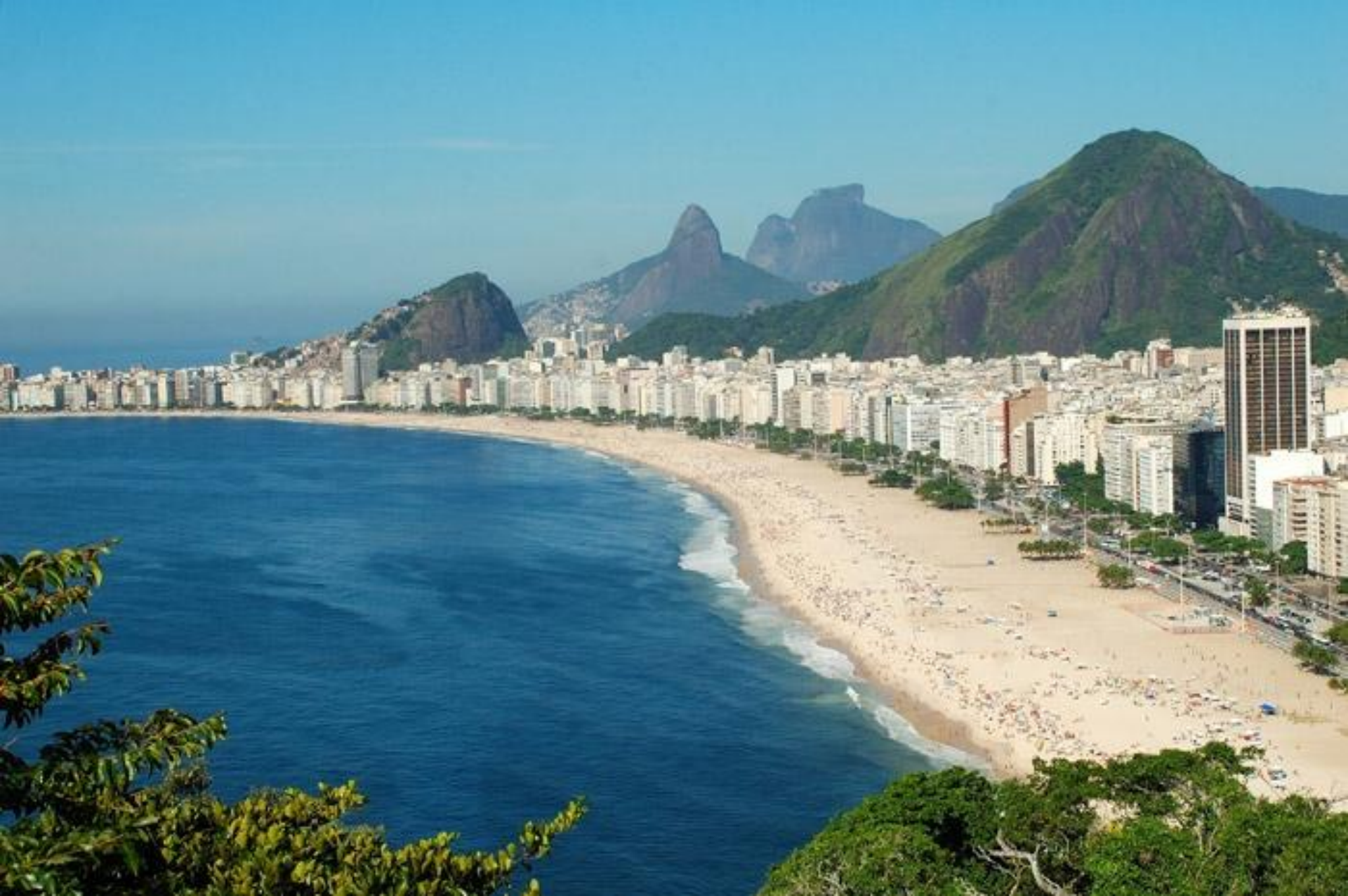
Пляж Копакабана в Рио.