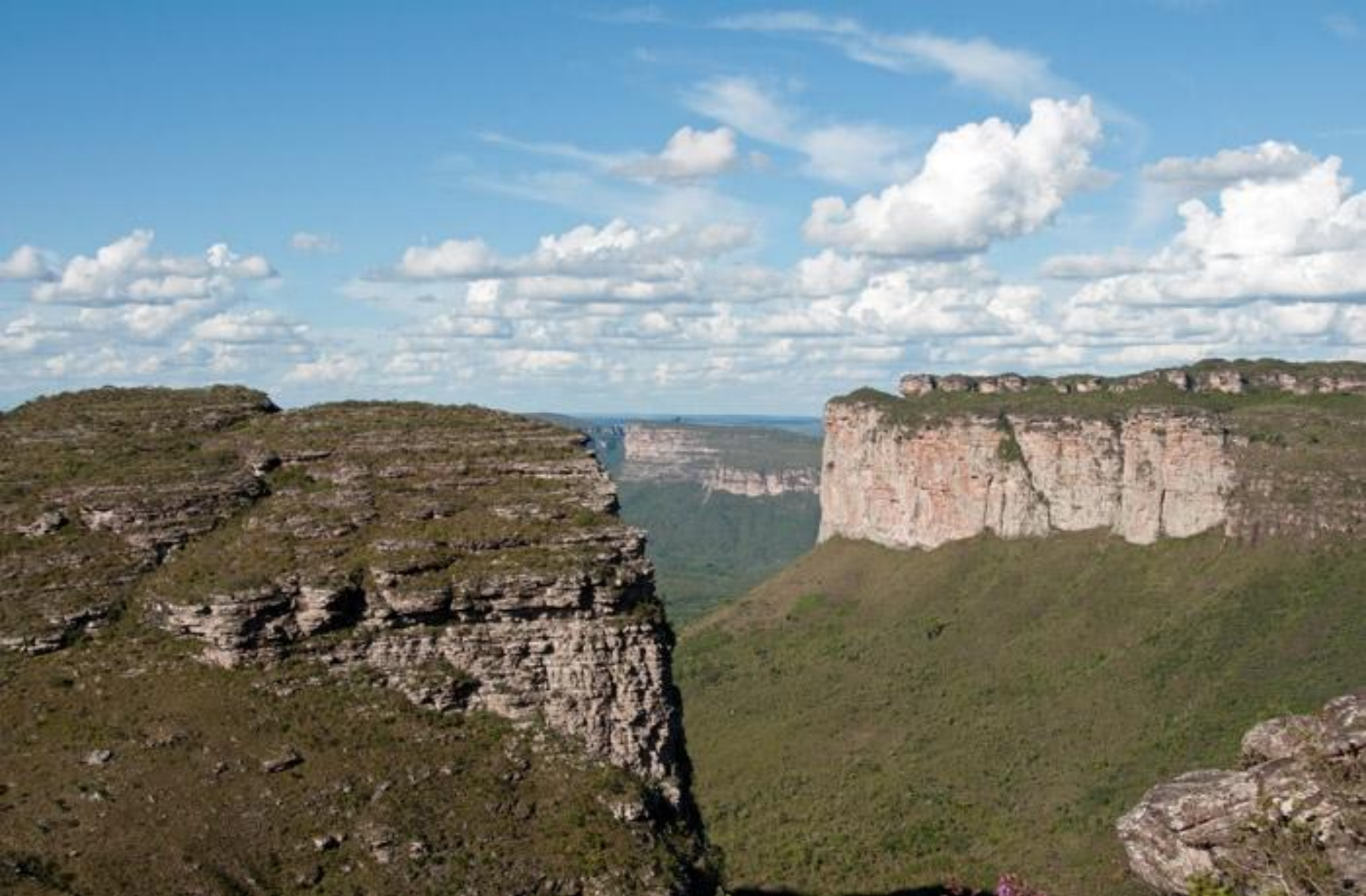
Національний парк Шапада Діамантина.