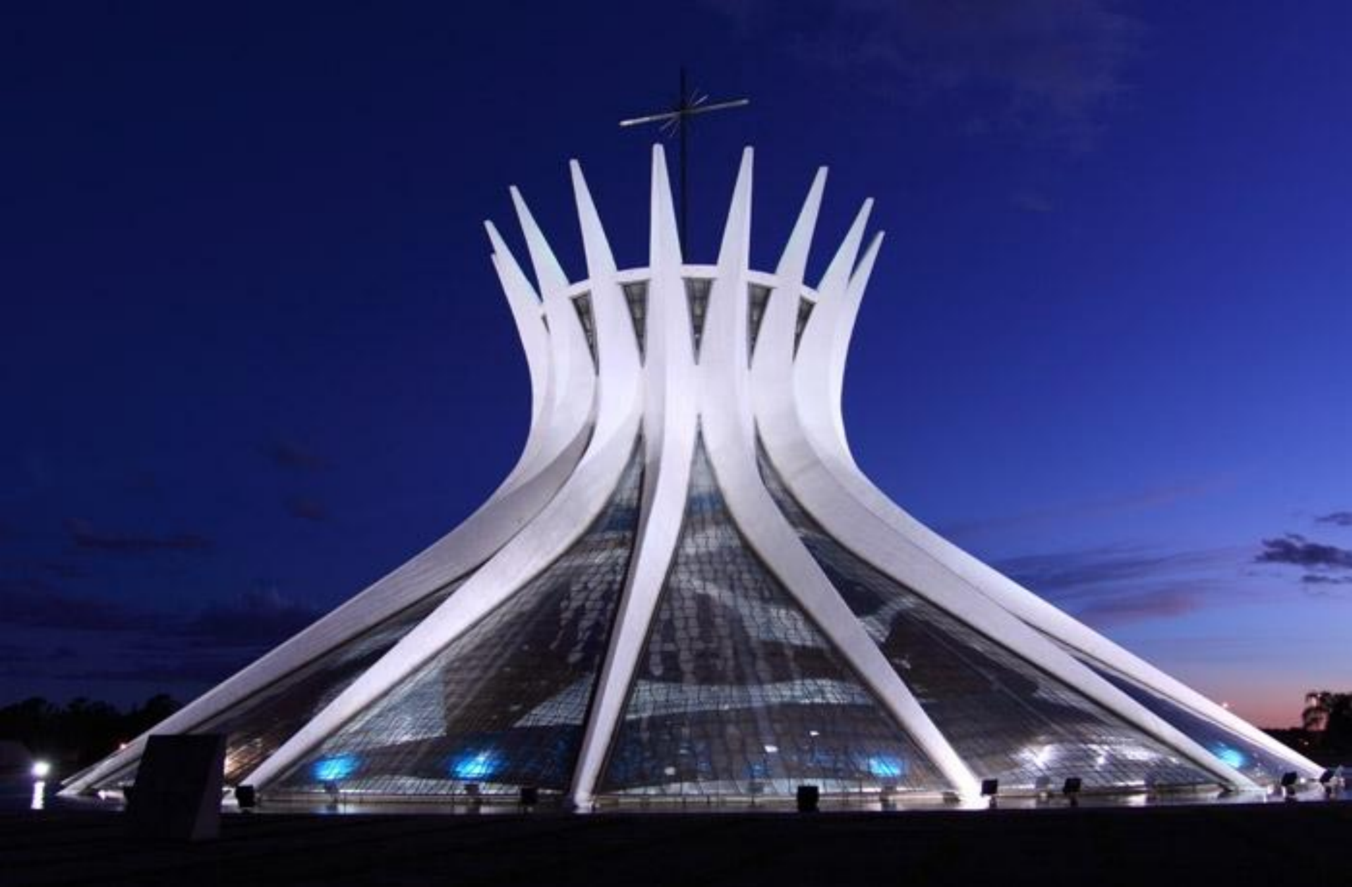
Кафедральный собор Бразилии.