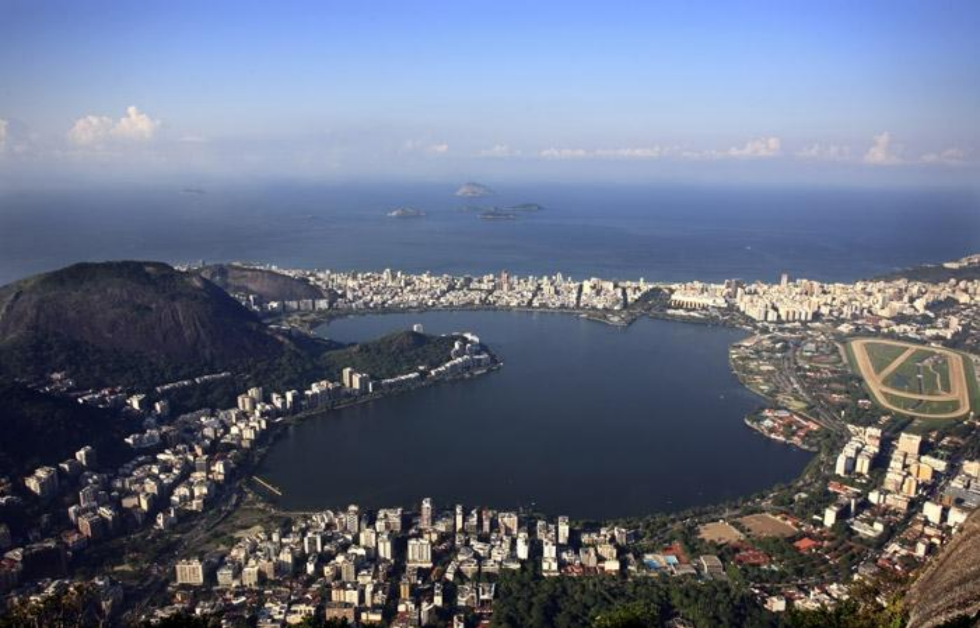
Лагуна Родріго де Фрейтас, Ріо-де-Жанейро.