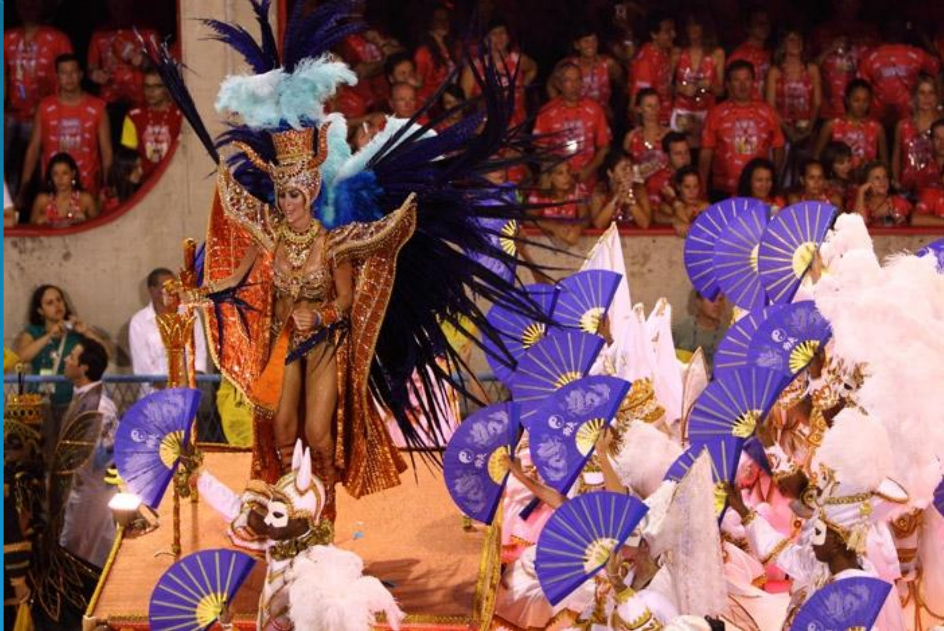
Карнавал у Рио-де-Жанейро.