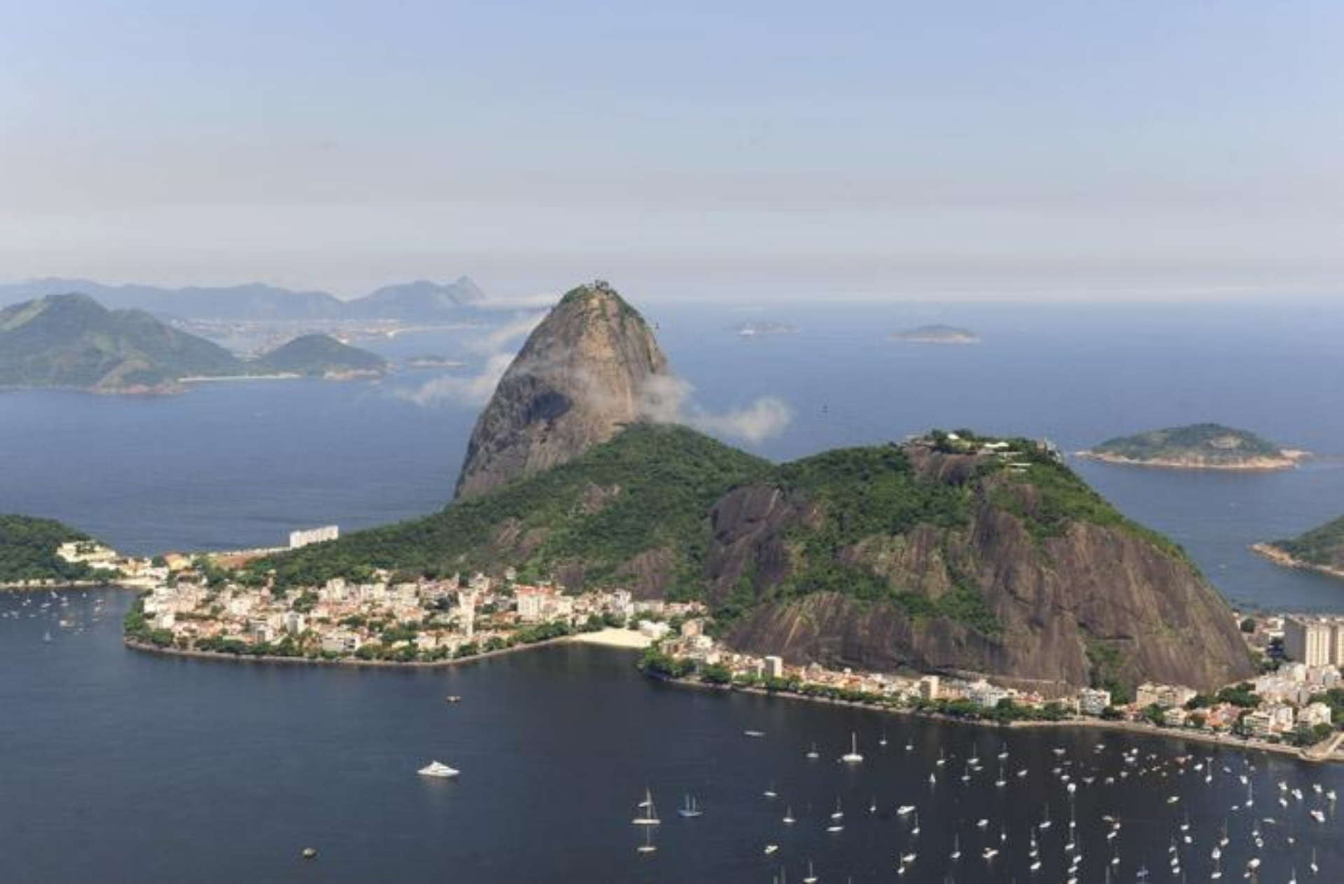
Цукрова голова в Ріо-де-Жанейро.