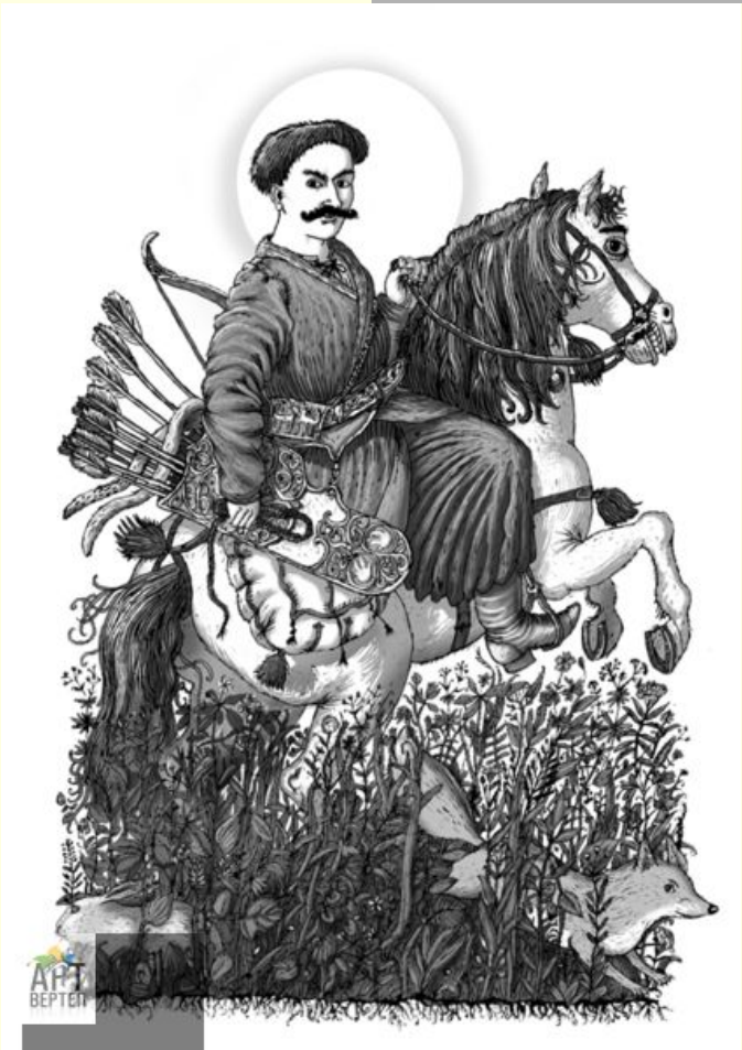
Ілюстрація до книги В.Рутківського «Джури козака Швайки»