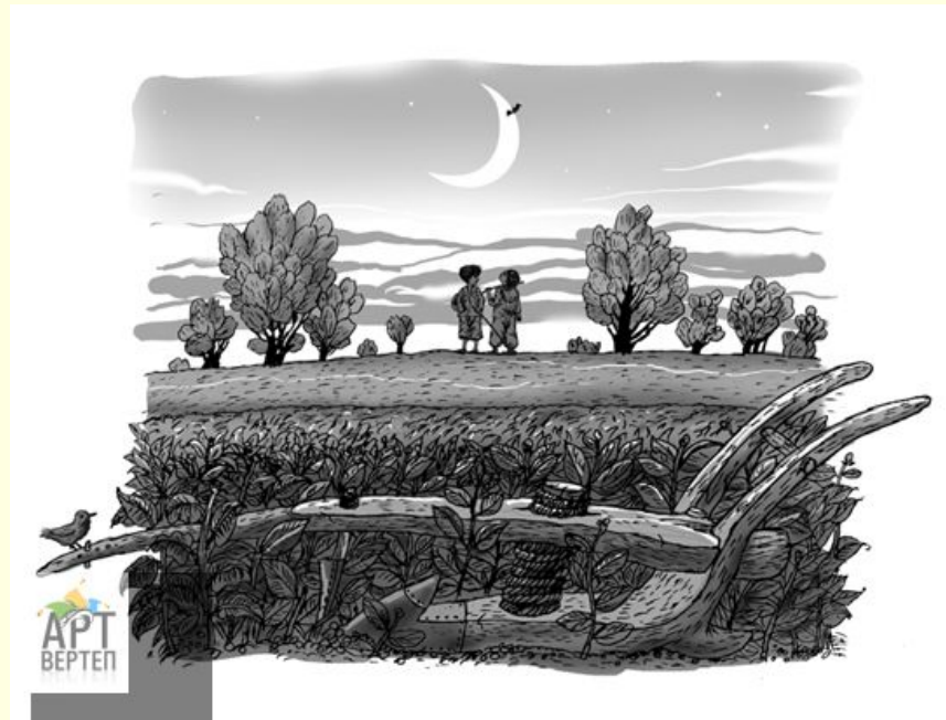
Ілюстрація до книги В.Рутківського «Джури козака Швайки»