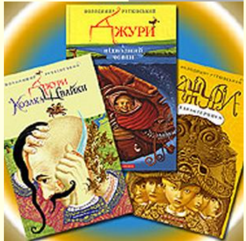
Трилогія Володимира Рутківського про «Джур»

Читабельність історико- пригодницького роману В. Рутківського «Джури козака Швайки».