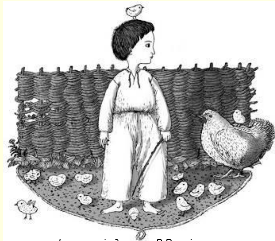
Ілюстрація до книги В.Рутківського «Джури козака Швайки»