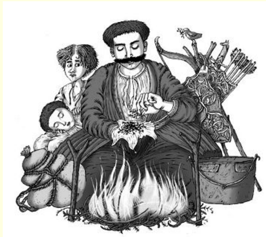
Ілюстрація до книги В.Рутківського «Джури козака Швайки»