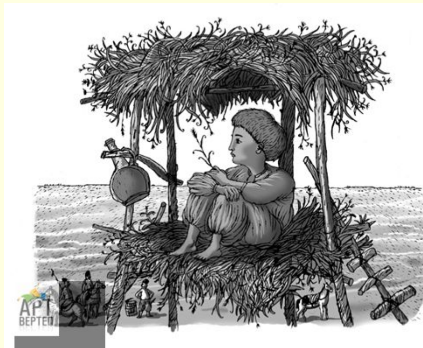
Ілюстрація до книги В.Рутківського «Джури козака Швайки»