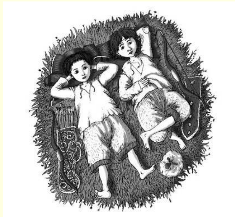
Ілюстрація до книги В.Рутківського «Джури козака Швайки»