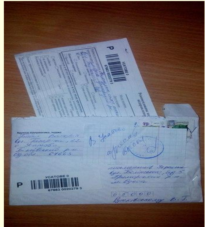
Лист- інтерв'ю В.Рутківському