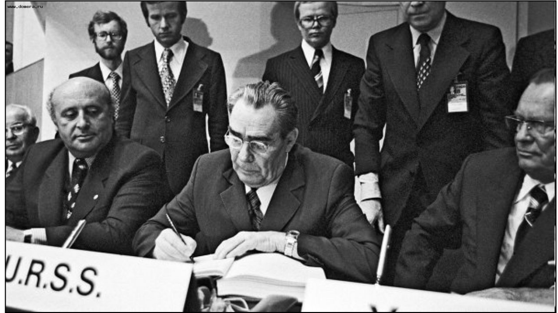
Л.Брежнев на Совещании по безопасности в Европе