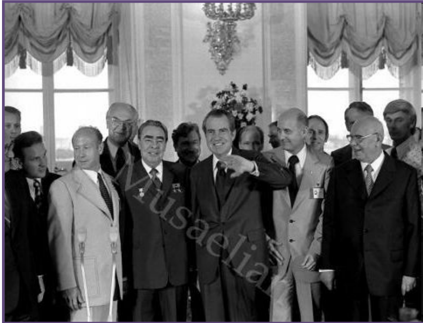
1972 год. Москва. Официальный визит Президента США Ричарда Никсона в СССР.