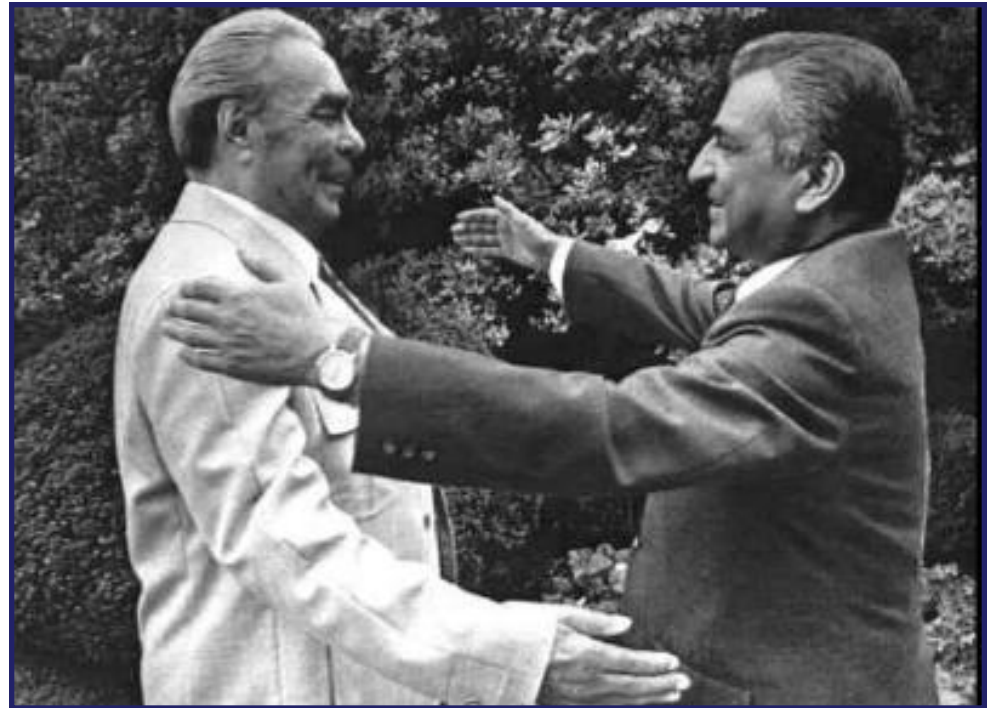
Л.Брежнев и Б.Кармаль, лидер Афганистана

СССР надеялся, что освободившиеся от колониализма страны пойдут по пути коммунизма. Особые надежды возлагались на Афганистан . В 1978г. здесь к власти пришли прокоммунистические силы, но между их лидерами разгорелась борьба за власть. 25 декабря 1979 г. после долгих споров среди советских руководителей в Афганистан были введены советские войска для поддержания стабильности в регионе.