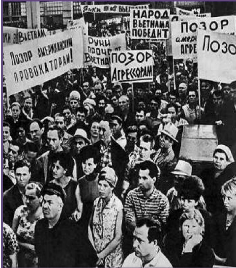
Митинг на АЗЛК против войны во Вьетнаме.

В середине 60-х гг. международная обстановка осложнилась.