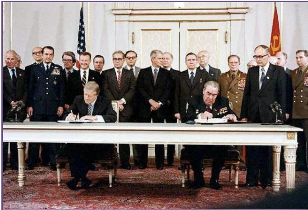
Дж. Картер и Л.И.Брежнев подписывают договор ОСВ-2. 1979 г.

1979 г. - подписание второго Договора по ограничению стратегических вооружений ( ОСВ-2 ) между СССР и США, установившего ограничения на качественные параметры совершенствования ядерного оружия.