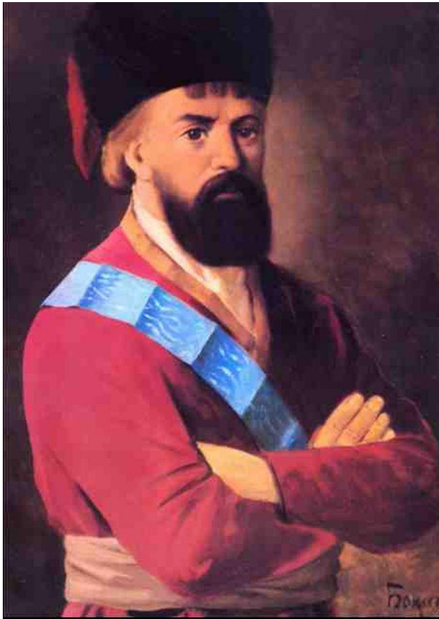
Емельян Иванович Пугачёв (1742 –1775 гг.)