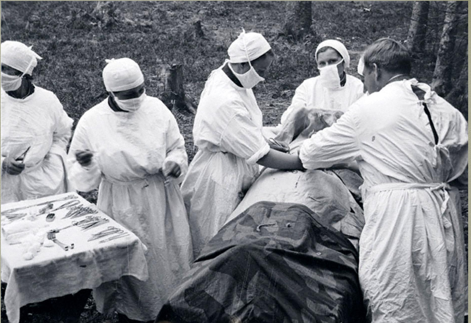
Операция в полевых условиях.