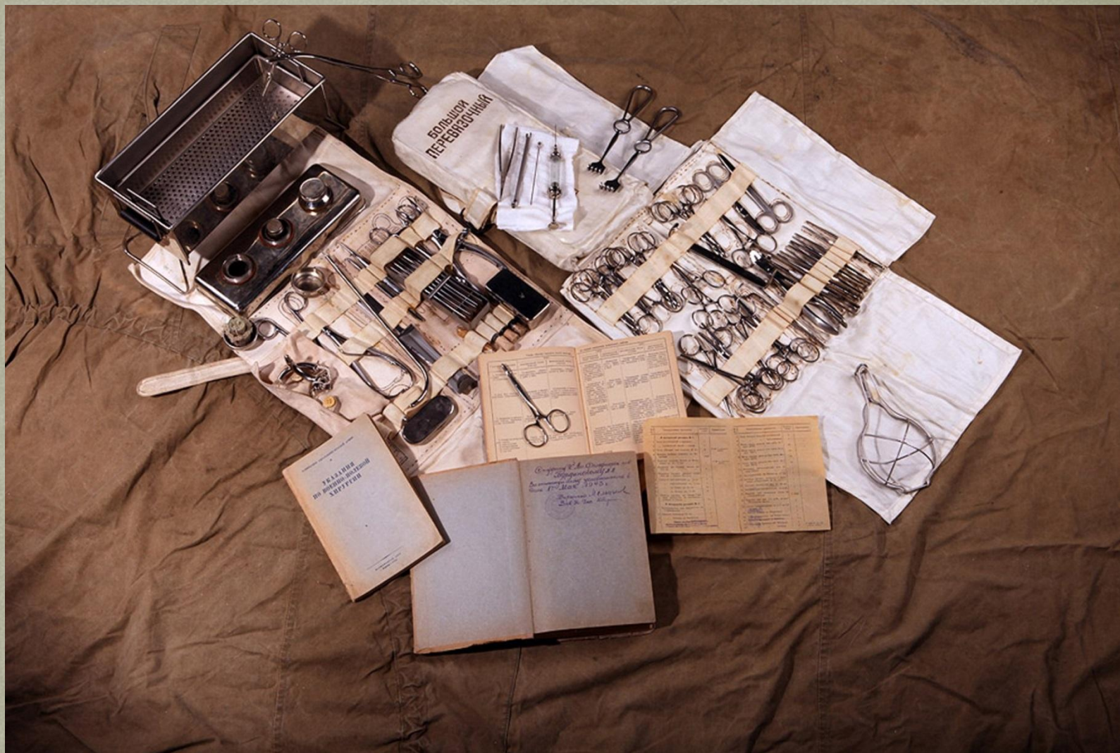
Набор медицинских инструментов для оказания помощи раненым.