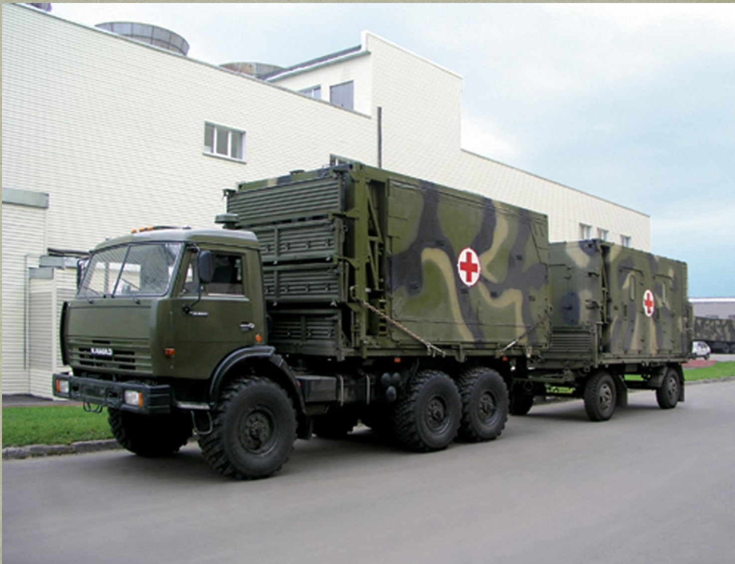
Мобильный полевой госпиталь.