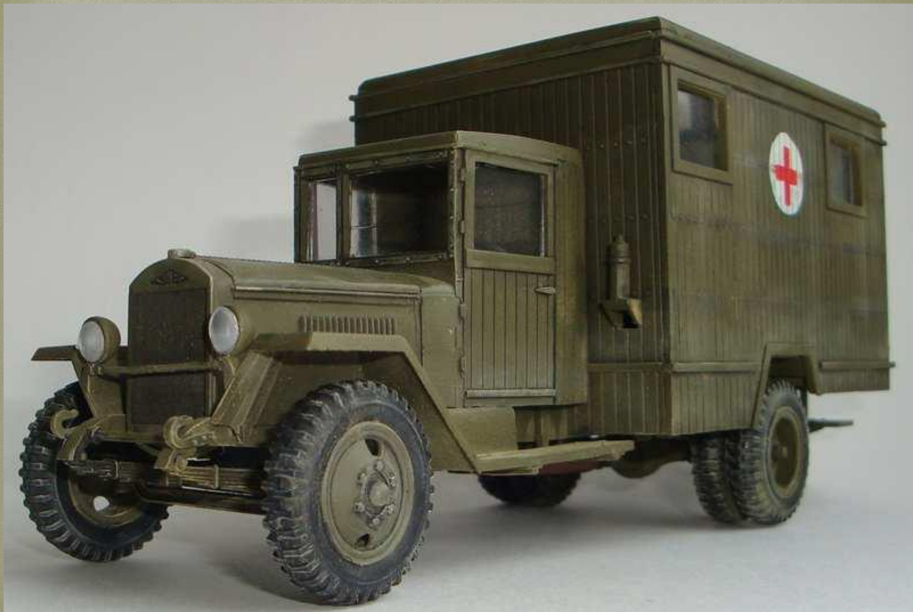
Санитарный автомобиль ЗИС-44