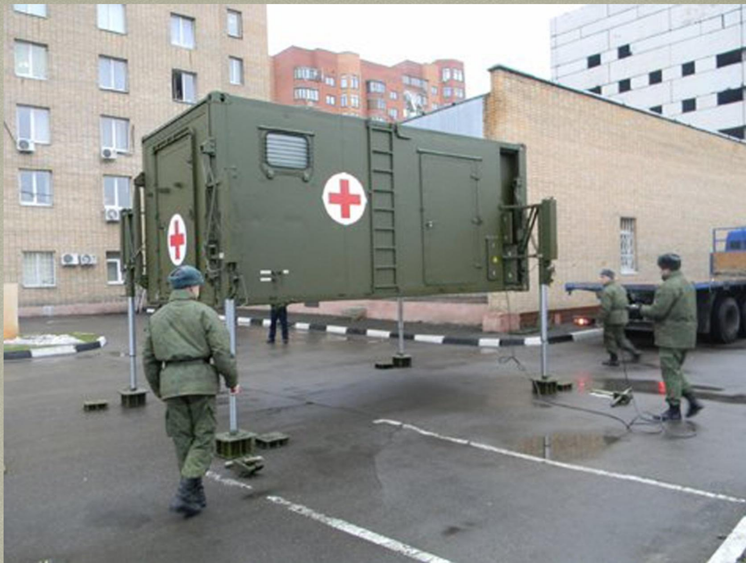
Монтаж мобильного полевого госпиталя