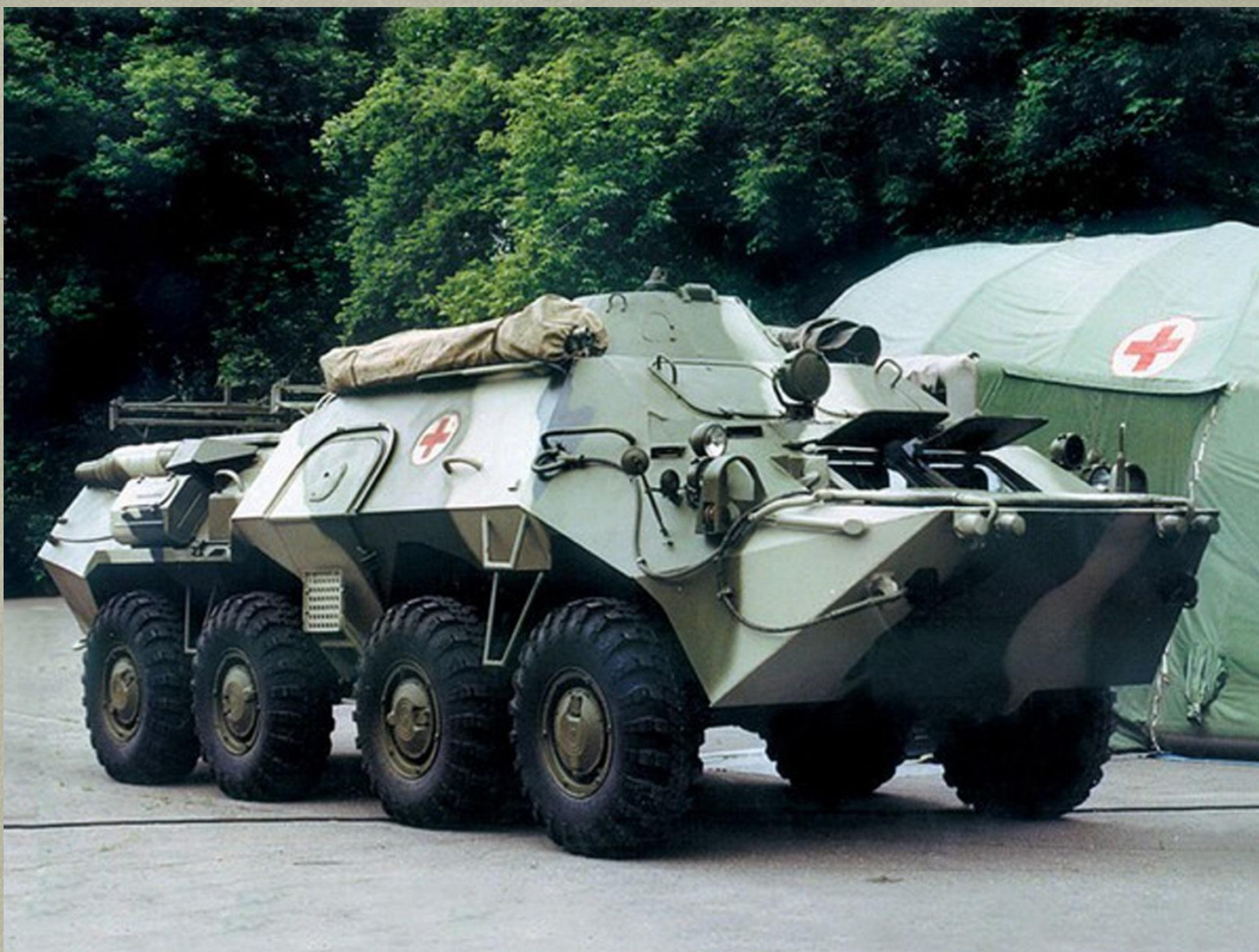
ГАЗ-59039 "БММ" - бронированная медицинская машина