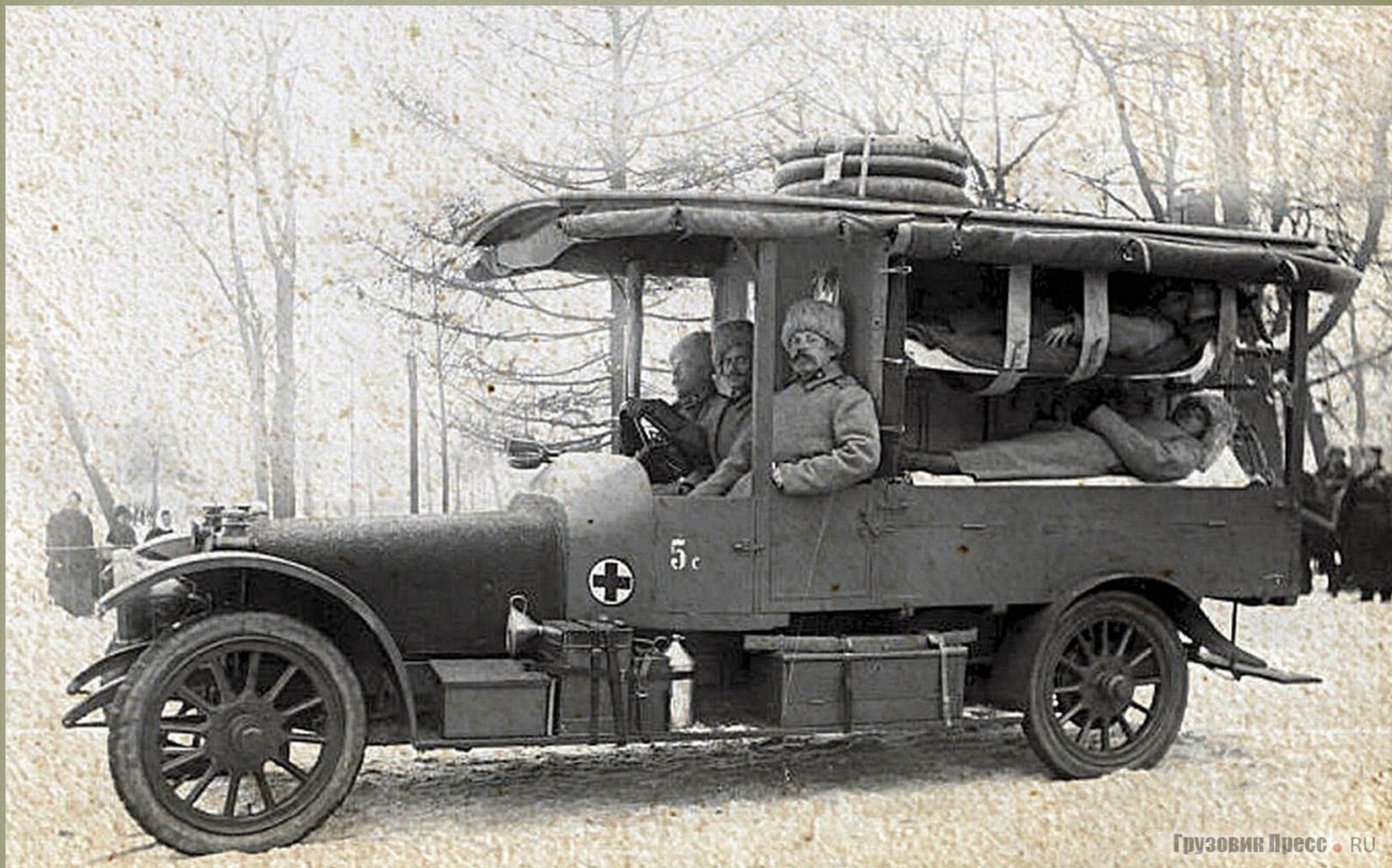
Перевозка лежачих раненых в машине санитарно-автомобильного отряда. Петроград, 1915 г.