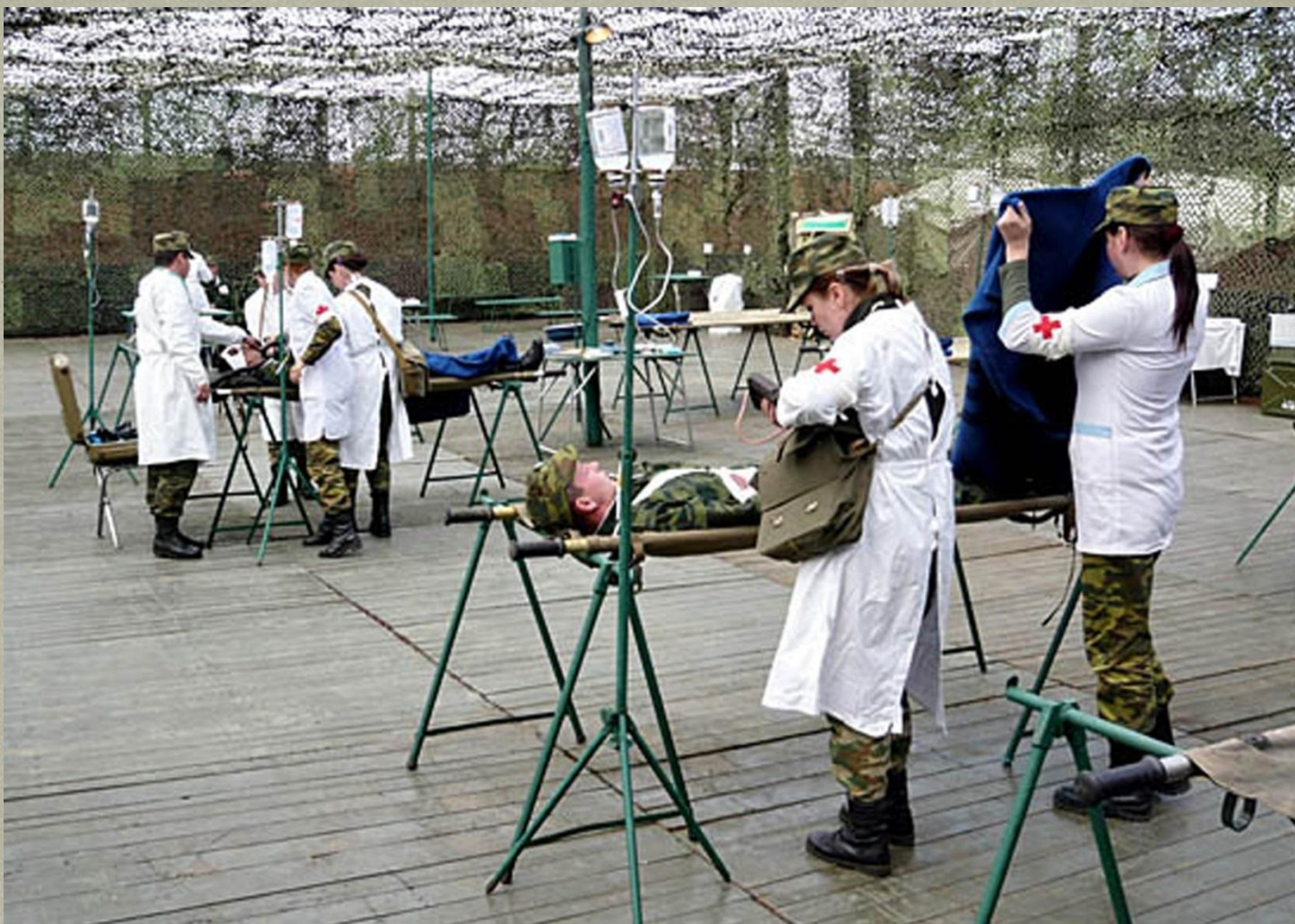
Полевой пункт оказания первой помощи раненым.