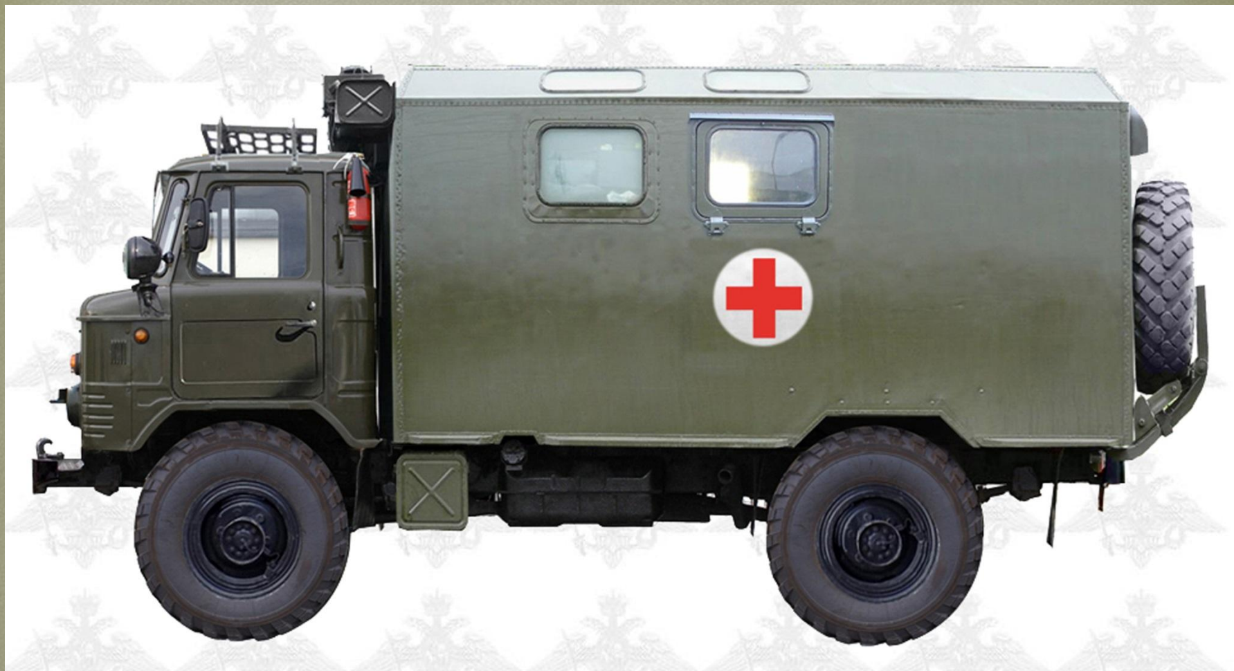
Санитарный автомобиль АС-66 на базе грузового автомобиля ГАЗ-66