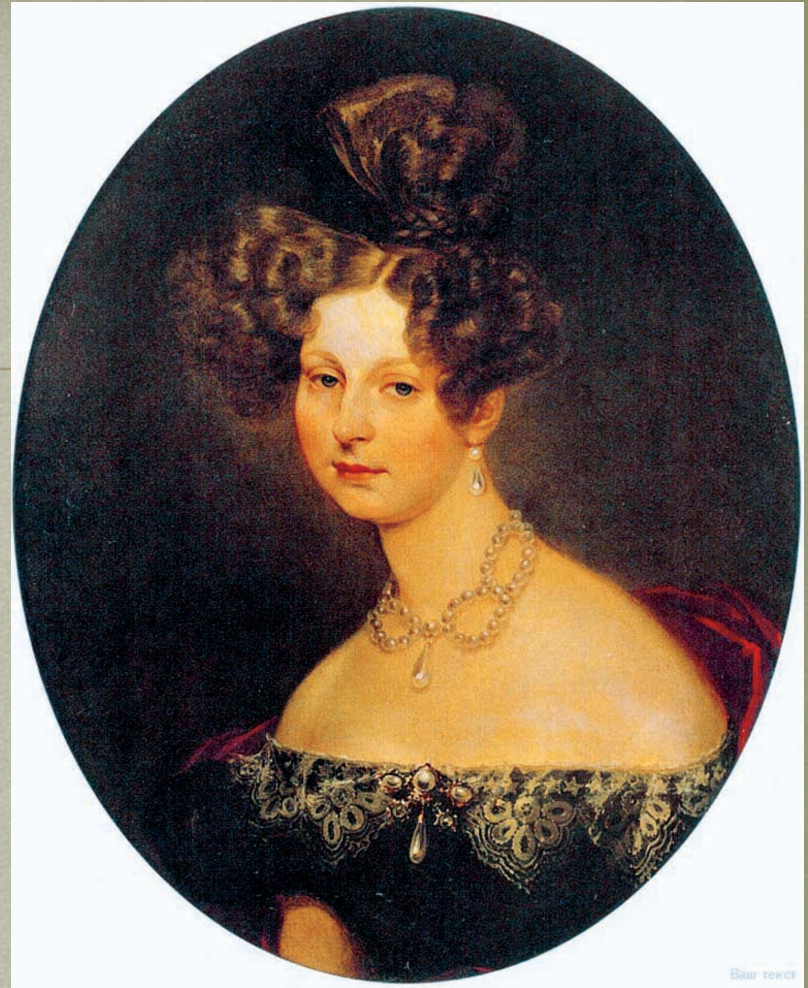
Великая княгиня Елена Павловна – основательница Крестовоздвиженской общины.

По окончании Крымской войны 68 сестёр милосердия были удостоены медали «За оборону Севастополя».