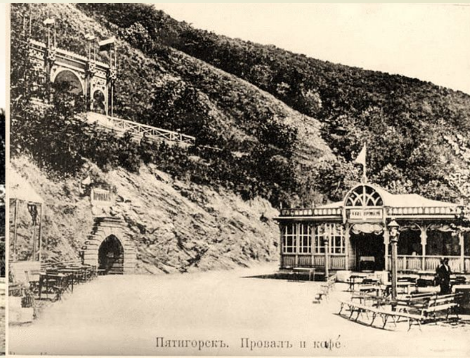
Пятигорскъ. Проваль и кафе.