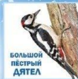
БОЛЬШОЙ ПЁСТРЫЙ ДЯТЕЛ