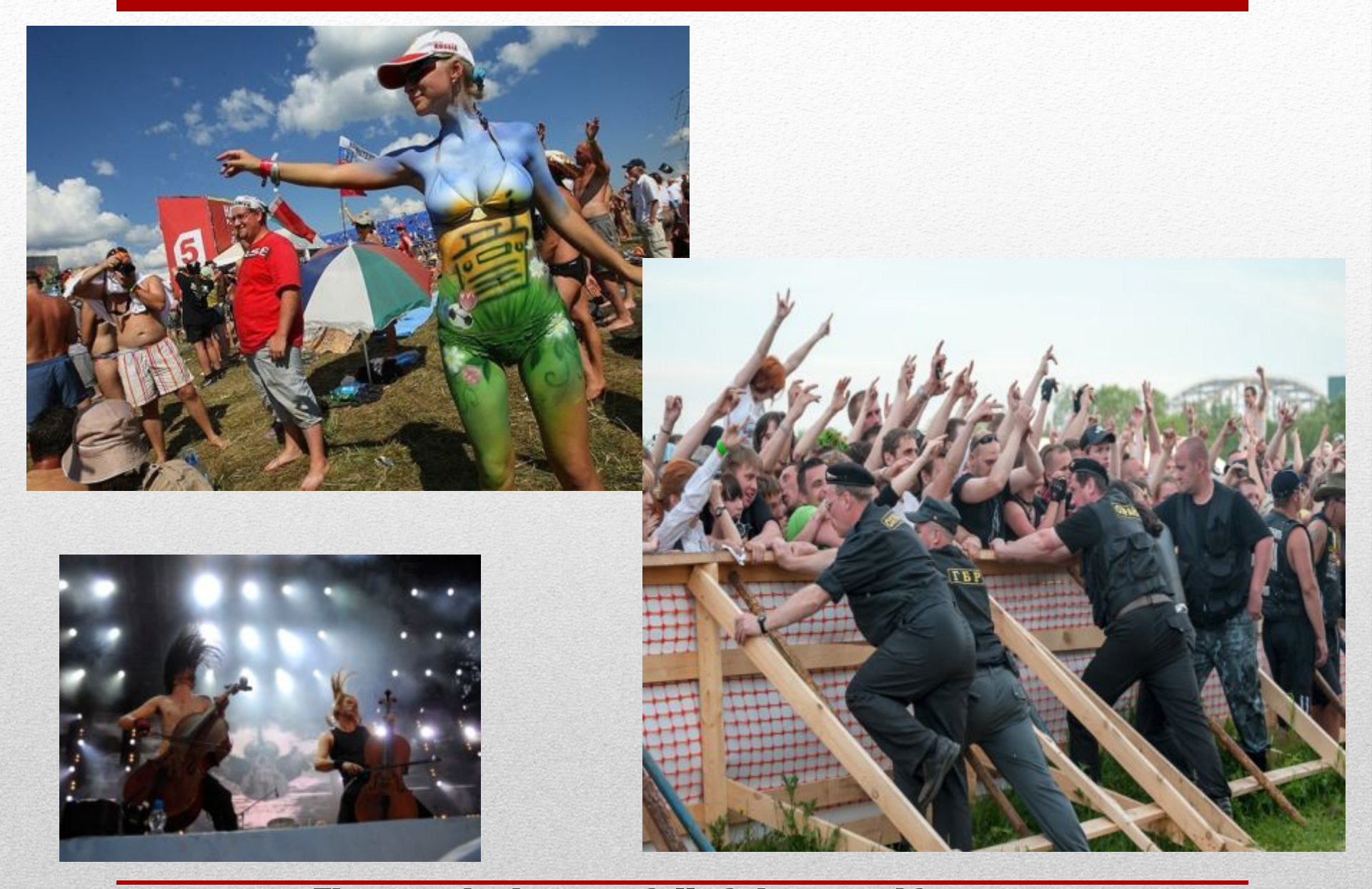
The new rhythms are full of vigour and force