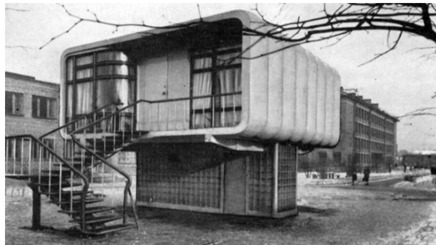
1961 г. – дом из пластмассы