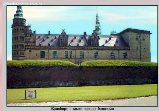
Кронборг - замок принца датского