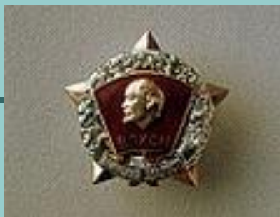
Нагрудный Знак ЦК ВЛКСМ «Воинская доблесть»