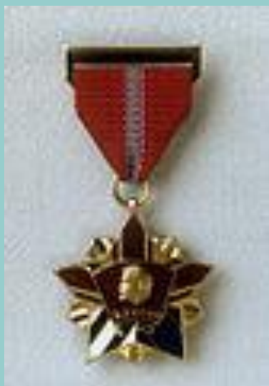
Почетный знак ВЛКСМ. Учрежден 28 марта 1966 году.