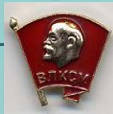
Нагрудный членский значок Комсомольца ВЛКСМ