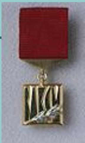
Знак Лауреата Премии Ленинского комсомола. Учрежден в 1966 году