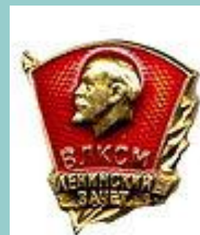
Нагрудный значок ВЛКСМ «Ленинский зачет»