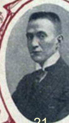
А. Ф. КЕРЕНСКИЙ, одинъ изъ прокуроровъ Св. Синода.