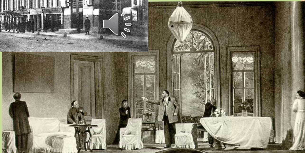
Московский художественный театр (МХТ)