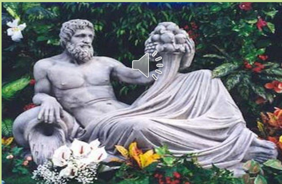
Бог виноделия и земледелия Дионис

Годом рождения мирового театра считается 534 г. до нашей эры.