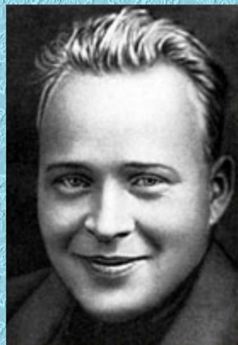
Аркадий Петрович Гайдар

Изучи биографию писателя. Можно ли сказать, что А. Гайдар был лидером. Докажи или опровергни.