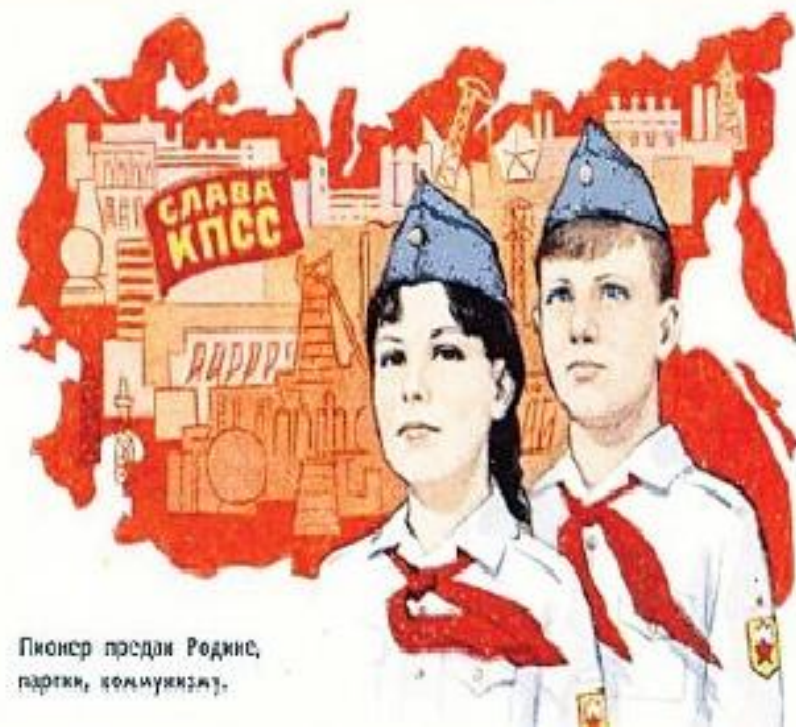
Пионер предки Родина, партии, коммунизму.

Март 1926 года - Пионерская организация стала именоваться - Всесоюзная пионерская организация им. В.И.Ленина.