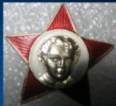
Значок Октябрятский Октябрёнка